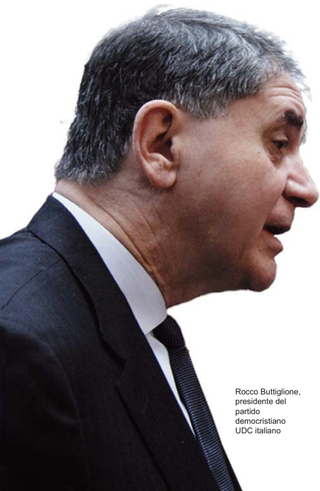
Rocco Buttiglione, presidente del partido democristiano UDC italiano