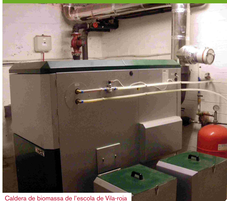
Caldera de biomassa de l'escola de Vila-roja

Des de les àrees d'Educació i Medi Ambient hem dut a terme un seguit de projectes per tal de reduir el consum energètic i l'emissió de CO 2 a les escoles. L'aposta més important ha estat la col·locació d'una caldera de biomassa al CEIP de Vila-roja que funciona amb estella vegetal. La caldera ha substituït una caldera de gasoil que suposava un cost anual de 8.500 euros. Per contra, amb la de biomassa, el cost serà de 2.500 euros, estalviant 5.500 euros cada any. És la primera caldera d'aquest tipus instal·lada als centres escolars de Girona i segueix les línies estratègiques del Pla Energètic.