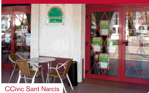
CCívic Sant Narcís

La Xarxa de Centres Cívics de Girona és el fruit d'una aposta municipal i veïnal que va generant dia a dia un model en el qual la cultura és un element viu per a la relació comunitària, l'articulació territorial i la cohesió social. El nostre grup municipal, que té la responsabilitat de dirigir-los, vol consolidar i fer créixer la Xarxa de Centres Cívics com el model d'equipament de proximitat de l'Ajuntament de Girona. I, per tant, cal arranjar els equipaments existents i crear-ne de nous.