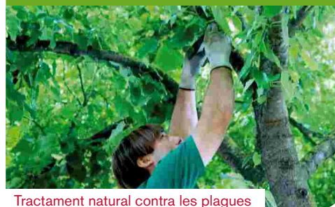
Tractament natural contra les plagues

El ruixat als arbres des d'un camió cistella amb insecticides químics era una imatge habitual als carrers en arribar la calor. Estudis de toxicologia demostren que l'exposició breu a nivells molt alts d'aquests compostos pot afectar al sistema nerviós i reproductiu dels mamífers. Mareig, mal de cap i cansament són els símptomes habituals d'una intoxicació lleugera. L'alternativa a aquests productes, tal i com passa en l'agricultura, és un canvi de concepte i treballar d'una forma eco-lògica.