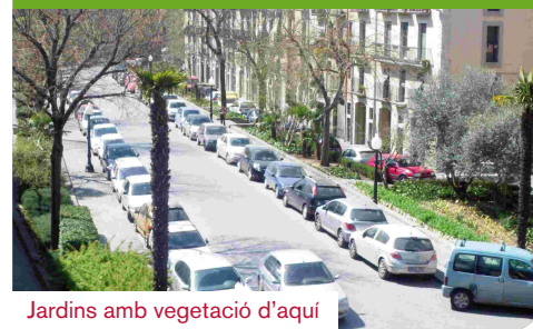
Jardins amb vegetació d'aquí

El consum global d'aigua potable s'ha reduït un 7% en els mesos posteriors a la sequera, fet que demostra que la penúria viscuda ha servit perquè ens conscienciéssim de la necessitat d'estalviar aigua. També l'Ajuntament ha après algunes lliçons. En aquests moments les fonts ornamentals s'estan reconvertint per funcionar amb un circuit tancat d'aigua i les piscines han canviat el tractament amb clor pel d'ozó.