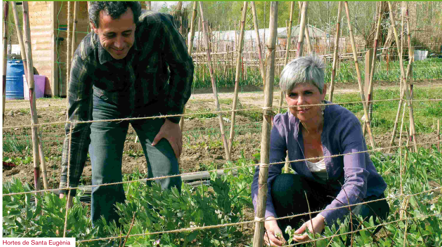
Hortes de Santa Eugènia

Si durant la passada sequera la reducció del consum d'aigua era una bona notícia, perquè no acceptem com igualment bo que baixi el consum de petroli, electricitat o gas? És una crisi per als qui el venen però és un innegable gran estalvi pel planeta, un respir. I també és alleujament per als seus habitants, enfollits per una febre consumista, animada amb fortes dosis de publicitat i d'insatisfacció personal, que ens mantenia en la necessitat de treballar frenèticament. Tot per continuar amb un ritme de consum creixent d'uns béns, matèries i energia que estaven molt, però molt, per damunt d'allò que l'ONU considera les necessitats bàsiques de tot ésser humà.