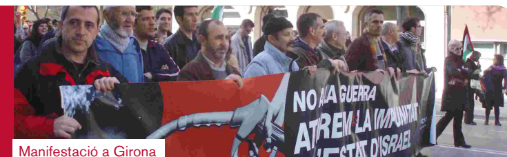
Manifestació a Girona

Des del grup municipal d'ICV-EUiA fem una crida al cessament de tota violència en el conflicte àrab-israelià. Creiem que és necessari recuperar l'esperit d'Oslo, i fomentar el diàleg i els ponts d'enteniment entre ambdues comunitats. Per aquest motiu, mostrem el nostre suport a les