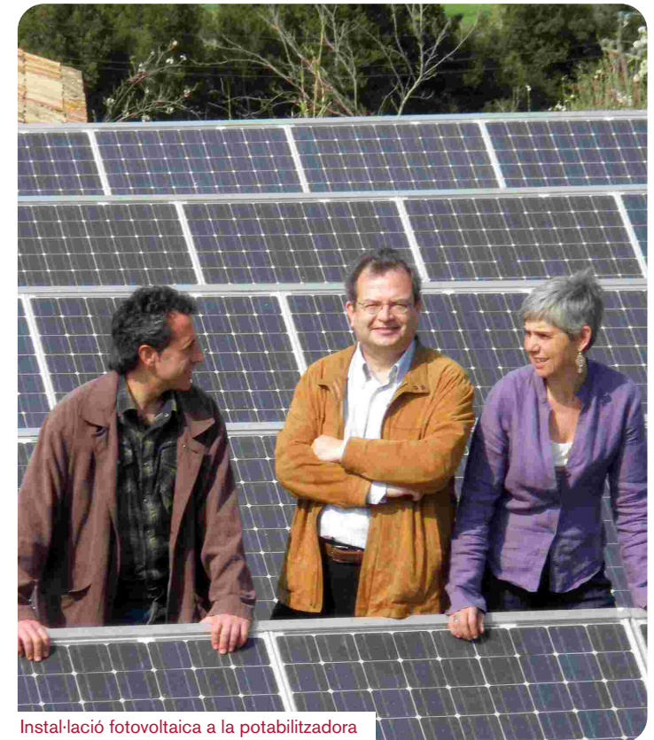
Instal·lació fotovoltaica a la potabilitzadora

Instal·la algun sistema de producció d'energia que no depengui de les xarxes, com poden ser molins de vent domèstics o nàutics, panells d'energia solar, calefacció amb biomassa (llenya, estelles, etc.), qualsevol producció per petita que sigui i fa més lliure. Si tens sol i un balcó, terrassa o pati prova la cuina solar, funciona tant a l'hivern com a l'estiu.