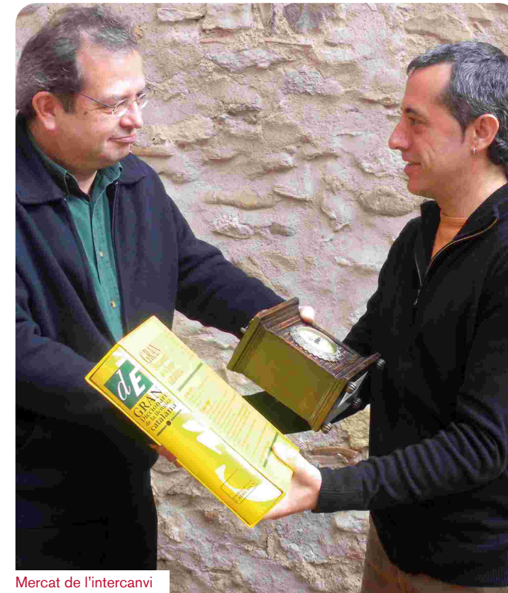
Mercat de l'intercanvi

Els interessos se't poden menjar. Si tens deutes la màxima prioritat és liquidar-los avançadament. Si necessites diners recorre a persones de confiança que te'ls puguin deixar. Si no et queda més remei que endeutar-te fes-ho pel mínim de capital i el mínim de temps d'amortització possible i posa't el seu retorn com a màxima prioritat. Calcula que puguis assumir la quota si els interessos pugessin per damunt del 10 o el 15%.