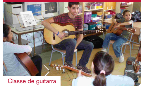
Classe de guitarra

Des de l'Ajuntament hem impulsat un conjunt d'actuacions educatives agrupades sota el nom de "Donem la volta a les escoles" per afavorir la transformació social i educativa d'alguns centres de la ciutat. En concret es tracta d'aconseguir que 8 centres educatius de la ciutat tornin a recuperar el prestigi i siguin atractius educativament per a totes les famílies dels seus barris.