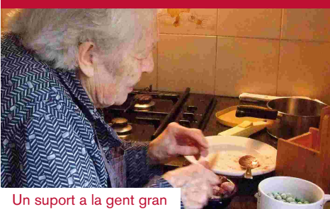
Un suport a la gent gran

Des de la seva implantació a finals de 2006, el nombre de persones grans que utilitzen la teleassistència no ha parat de créixer. A la ciutat ja són gairebé mil usuaris que fan ús d'aquest servei municipal a través del qual, tan sols prement un botó, poden avisar als encarregats del servei si necessiten ajuda.