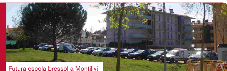
Futura escola bressol a Montilivi

De les tres escoles bressol projectades en el pla de mandat (2007-2011), enguany se'n comença la construcció de dues. La primera es farà al barri de Montilivi, al solar que hi ha entre els carrers Josep Bosch, Àngel Serradell i Palau Sacosta, prop de