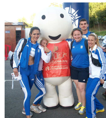
Barni amb l'equip grec