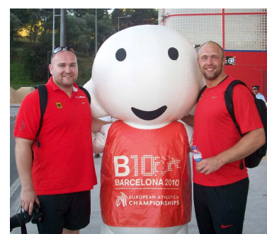
Peter Sack i Robert Harting

Reserva ja el teu abonament! e-mail a: tickets@bcn2010.org Per més informació consulti la nostra pàgina web: www.bcn2010.org