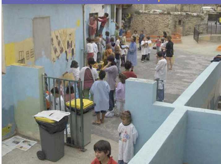
Els alumnes i mestres de Prada, en plena feina.

De fet, la participació dels pares i mares en el projecte de les escoles, i en molts dels afers de la vida quotidiana, és un dels trets distintius de la xarxa de la Bressola. A l'escola del Soler, també es va fer un cap de setmana complet de bricolatge amb pares i mares, mestres i alumnes. Durant les dues jornades es van pintar els despaxos, la sala de material i una de les aules. També es va fer molta feina d'endreça i de neteja de les instal·lacions de l'escola. En definitiva, un cap de setmana de treball i de convivència, amb els àpats comuns que havia preparat l'associació de pares i mares.