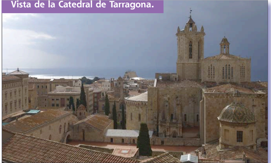
Vista de la Catedral de Tarragona.

Amb motiu de l'adhesió de l'Ajuntament de Tarragona la tinent de batlle de Cultura, Patrimoni i Ensenyament d'aquest municipi, Rosa Rossell, va publicar una carta al diari Més Tarragona. La reproduïm íntegrament en aquesta mateixa pàgina.