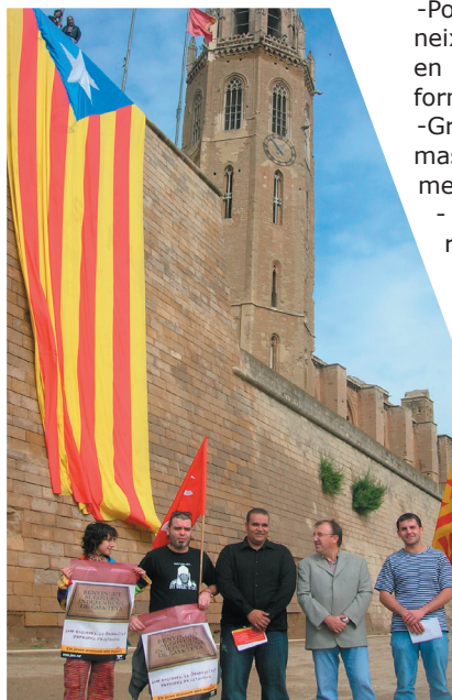
El programa es va presentar a la Seu Vella

Al mateix temps, s'ha de defugir de visions pejoratives del jovent, incentivades per una criminalització constant per part del mitjàns de comunicació. Amb el primer govern d'esquerres des de la Segona República s'ha iniciat un nou camí en polítiques de joventut, abandonant les centrades únicament en l'oci i el lleure i posant les bases per solucionar les problemàtiques socials del jovent. Els i les joves han de passar a jugar un paper actiu dins de l'estructura social i esdevenir la millor garantia per assolir la justícia social.