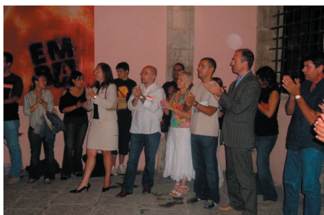
El Roser va congreguar 70 assistents

Com cada 10 de setembre, vigília de la diadanacional de Catalunya, les JERC-Ponent van fer la tradicional ofrena floral al Roser (Lleida).