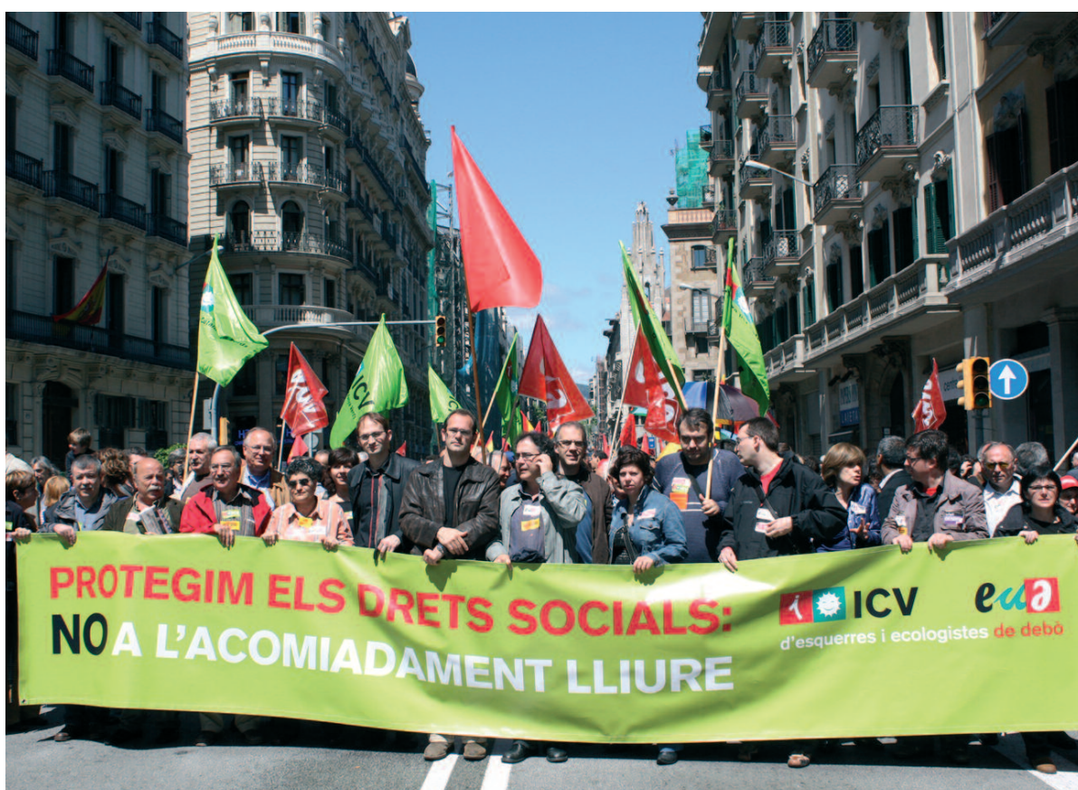
Capçalera d'ICV-EUIA a la manifestació del primer de maig, a Barcelona

Moderació i reducció salarial han conformat un element persistent en els anys de creixement econòmic. Els guanys d'aquest creixement han engraiat únicament les rendes del capital. Part de les rendes engraiades s'han destinat a especular preparant el terreny sobre el qual ha germinat la crisi. Per sortir-ne cal esmicolar aquest engranatge pervers. I una manera de fer-ho és assegurant una distribució de la riquesa més favorable a les rendes del treball, incrementant salaris i prestacions socials.