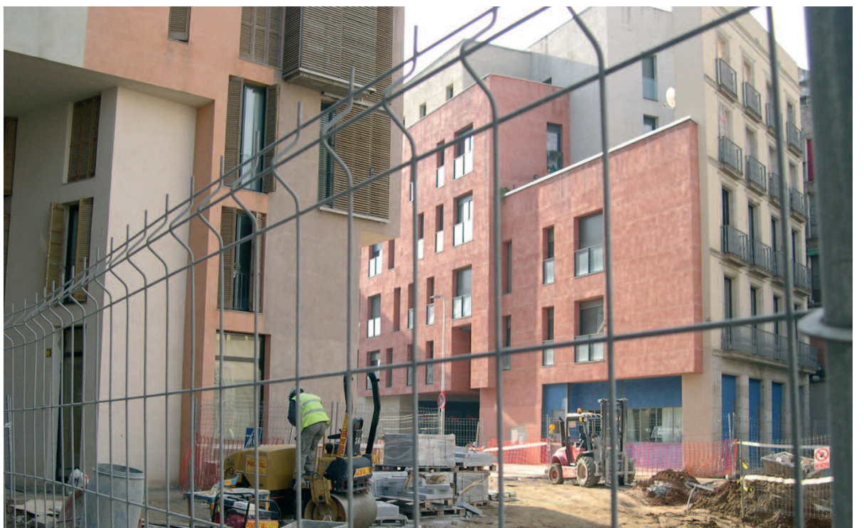
Cal promoure l'habitatge protegit

En canvi, les prioritats dels senyor Zapatero passen per altres llocs. Un trist exemple ha estat la presentació al Congrés d'una reforma de la Llei d'Arrendaments per aconseguir els desnonaments express ; és a dir, per facilitar i accelerar el desallotjament dels llogaters que tenen problemes per pagar el lloguer. Quin moment més inoportú ha trobat el govern per fer-ho! L'esmena a la totalitat presentada per Joan Herrera va ser rebutjada per PSOE, PP i CiU. Novament, comparant com es tracta banquers i llogaters, es fa realitat allò de feble amb els forts, fort amb els febles .