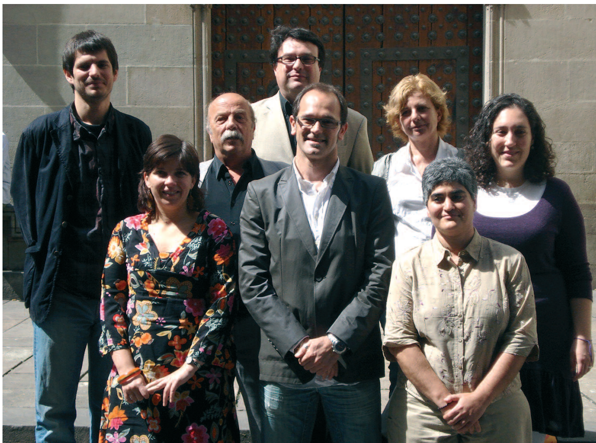
Acte de presentació de la candidatura europea de la coalició ICV-EUIA