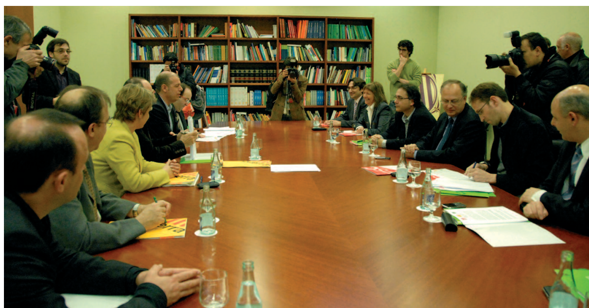
Imatge de la reunió dels partits polítics que formen el Govern, en què es va signar l'actualització del Pacte d'Entesa

- Catalunya no pot esperar més el nou finançament, ja que el govern ha d'impulsar més polítiques socials.