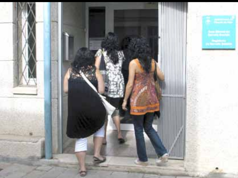
Cal destacar l'augment de les ajudes destinades a finançar els serveis bàsics.