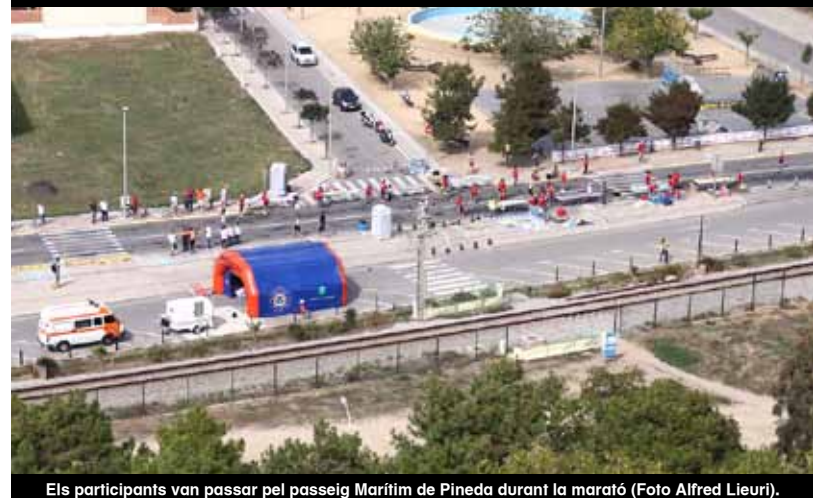
Els participants van passar pel passeig Marítim de Pineda durant la marató.