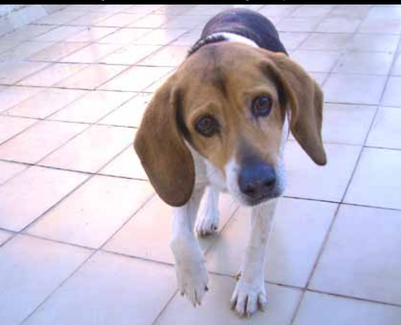
Els animals domèstics han d'estar xipats i censats.