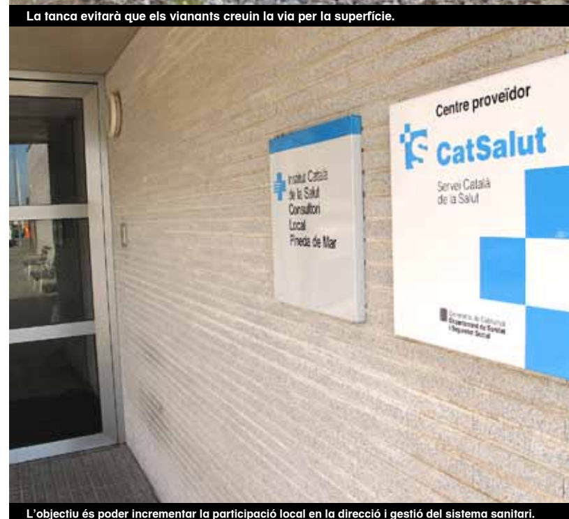
L'objectiu és poder incrementar la participació local en la direcció i gestió del sistema sanitari.