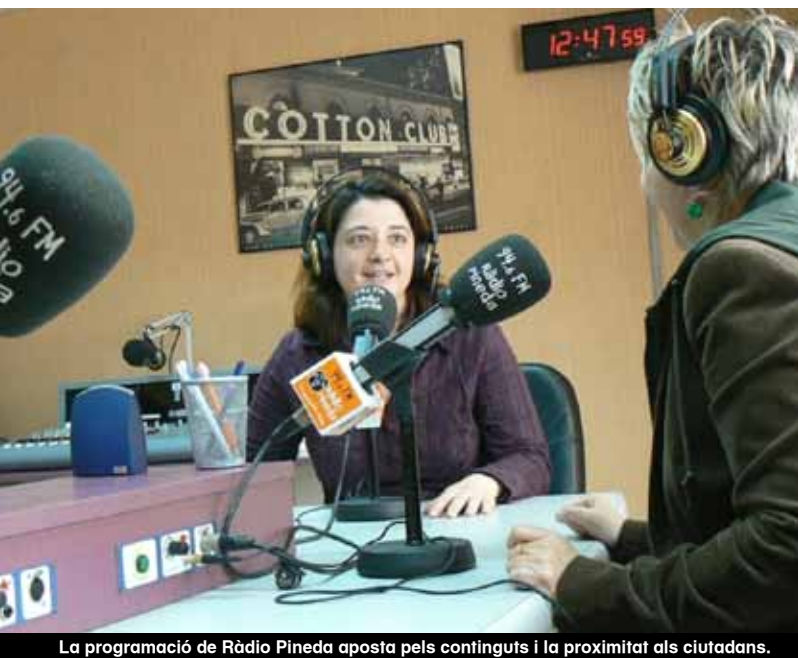
La programació de Ràdio Pineda aposta pels continguts i la proximitat als ciutadans.