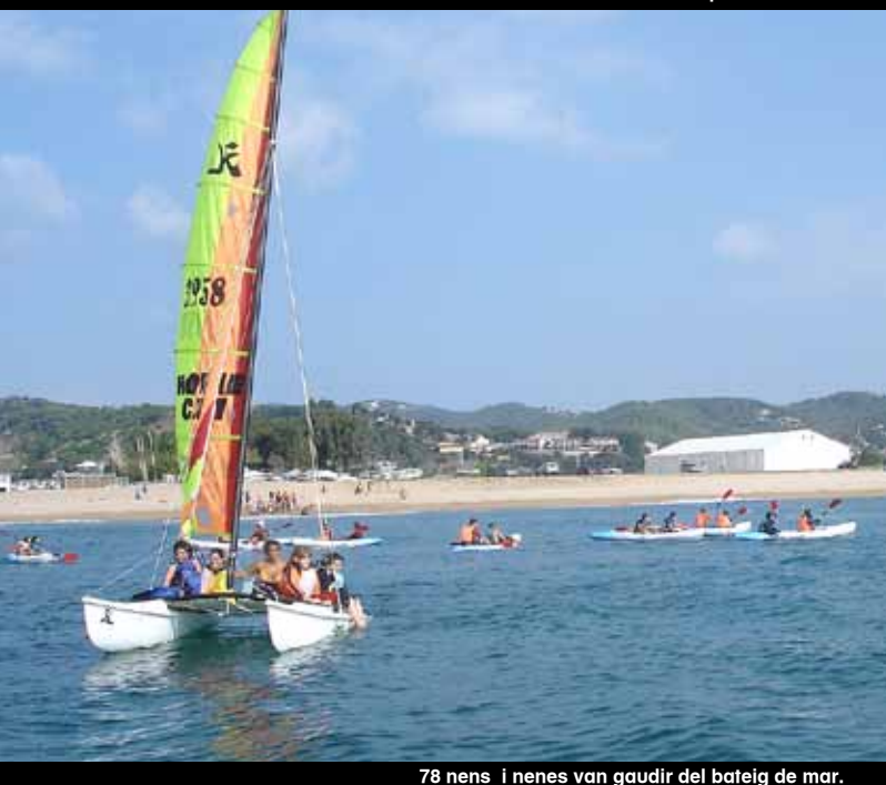
78 nens i nenes van gaudir del bateig de mar.