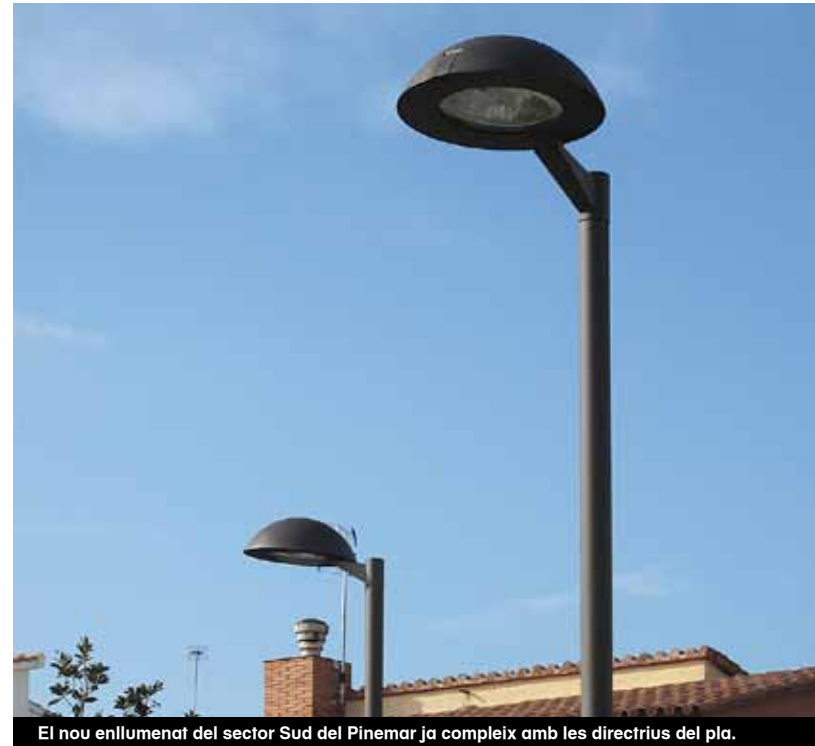
El nou enllumenat del sector Sud del Pinemar ja compleix amb les directrius del pla.

Els governs territorials de Salut tenen com a objectiu prioritari incrementar la participació del món local en la direcció i la gestió del sistema sanitari, creant un marc de col·laboració entre l'Administració de la Generalitat i els ens locals en matèria de planificació i prevenció de la salut. Aquests consorcis donen veu als ajuntaments en la política nacional de salut i tenen una composició equilibrada que garanteix la paritat en la presa de decisions entre els membres designats per les entitats locals i aquells designats pel Departament de Salut.