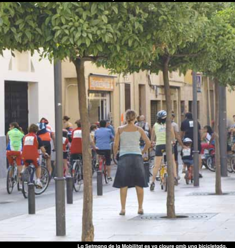
La Setmana de la Mobilitat es va cloure amb una bicicletada.