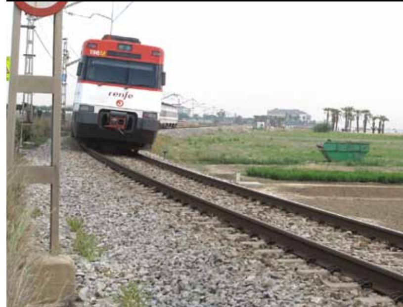
La tanca evitarà que els vianants creuin la via per la superfície.