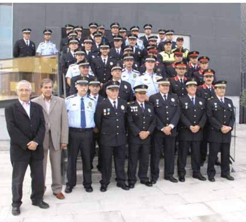
Els agents de la Policia Local vestits de gala a la porta del Centre Innova.