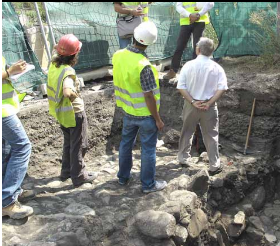
Les restes arqueològiques no endarreriran les obres de la planta.