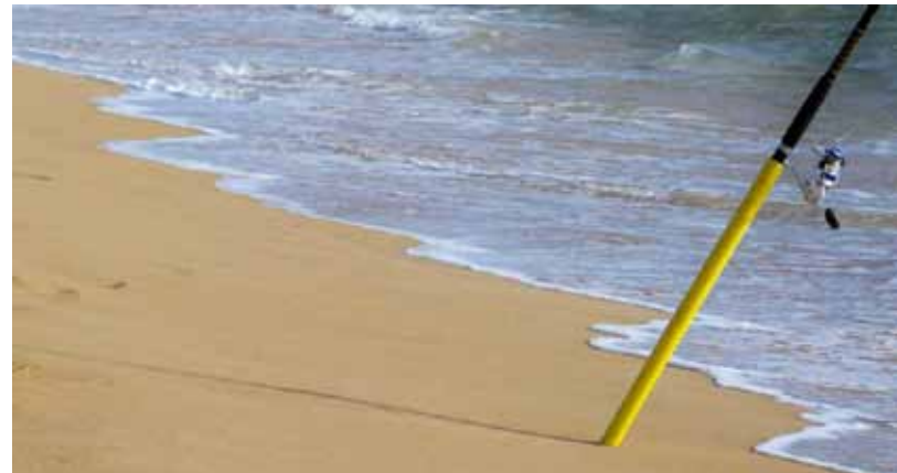
Un total de 140 pescadors van participar al campionat.

En l'àmbit esportiu, cal destacar que el guanyador va ser el català Marcel Zamora, amb un temps de 8 hores i 15 minuts. El segon classificat Mika Luoto, de Finlàndia, i el tercer l'alemany Bernd Eixhorn. En categoria femenina la guanyadora va ser la belga Sofie Goos, amb un temps de 9 hores i 8 minuts, la segona classificada Katja Konmschak i la tercera Hillary Biscay, dels Estats Units.