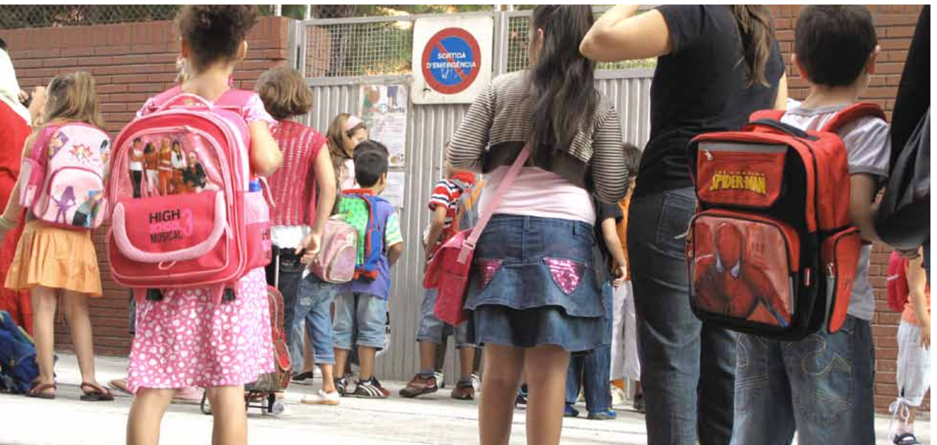
Els infants de l'Escola Sant Jordi es van trobar una vorera de seguretat més ampla.

Els centres educatius de Pineda de Mar van obrir el passat dilluns 14 de setembre puntualment les portes per iniciar el curs 2009-2010. En total a Pineda hi haurà més de 3.500 alumnes repartits en els vuit centres d'educació infantil i primària, els tres Instituts d'Estudis Secundaris i el Centre d'Educació Especial Horitzó. La gran novetat d'enguany és la implantació dels llibres digitals a l'IES Pineda, on els alumnes de 2n i 4t d'ESO han estat seleccionats per participar a la posada en marxa de la implantació dels llibres digitals, un projecte que s'estrena a un centenar de centres educatius d'arreu de Catalunya.