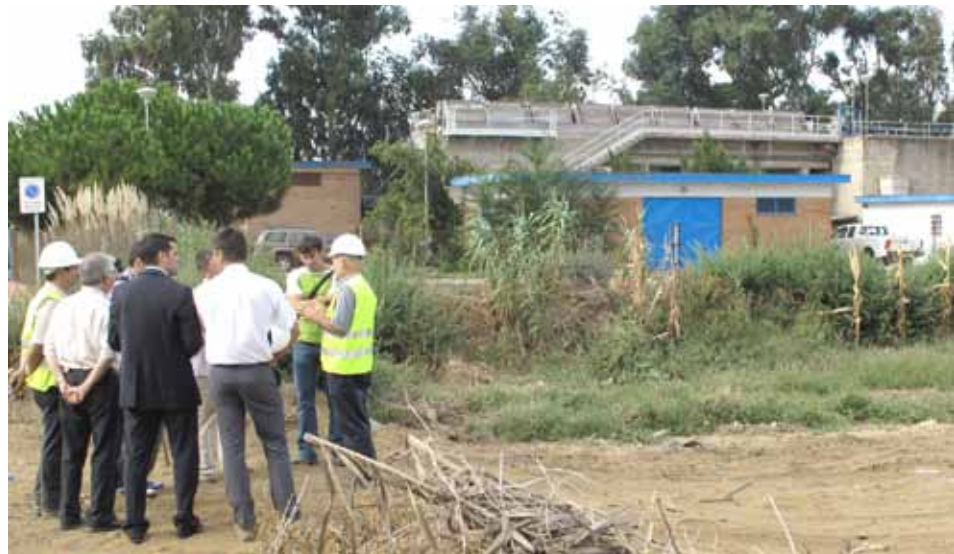
Per fer les obres s'han hagut d'expropiar temporalment uns 2.000 m 2 de terrenys.

Estol ha explicat que quan la nova instal·lació estigui en marxa l'emissari en un futur mitjà no s'haurà de fer servir, ja que l'ACA té el compromís de fer un reaprofitament del 100% de l'aigua. Això inhabilitarà l'emissari que només serà una sortida d'emergència d'aigua en excés provinent de la pluja.