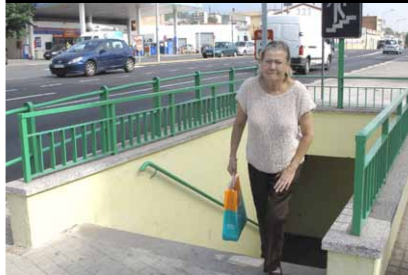
La gent gran i amb problemes de mobilitat tenen problemes per creuar la carretera.