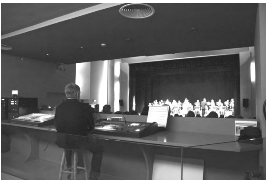
L'acte de lliurament dels premis Conrad Saló, al Teatre Mundial, el novembre passat.

Presentem la programació de teatre i de música per al primer semestre de l'any 2009.