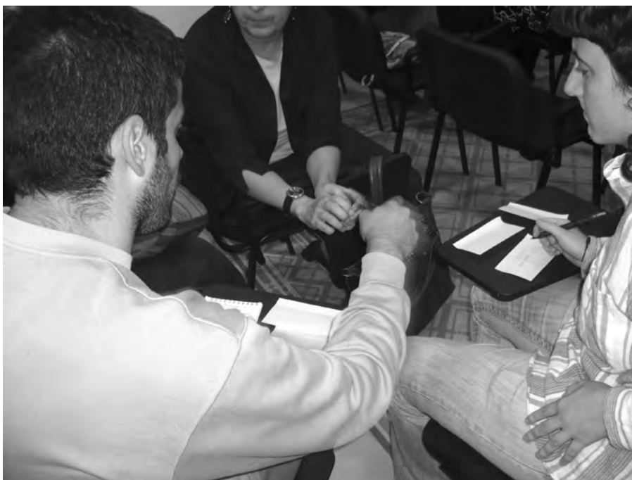
Una de les accions de participació ciutadana.

Aquesta fotografia haurà de servir, a partir d'ara, com a fonament per definir cap on volem anar en termes de promoció de la participació ciutadana. Per fer-ho, es preveu iniciar en breu la segona fase del procés que servirà per definir, a través de la celebració de diferents tallers participatius, un seguit de línies estratègiques, criteris i propostes d'actuació que serviran per planificar i omplir de contingut integral la política