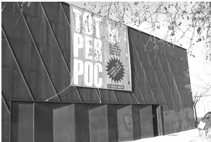
Firarebaixa Empordà es farà al pavelló firal sota l'eslògan 'Tot per poc.'

Firarebaixa Empordà torna amb vocació comarcal el 24 i 25 de gener