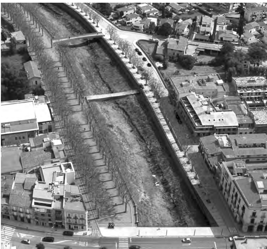
Imatge virtual de la zona que es reordena

Quant a la proposta del PSC de destinar aquests diners a la millora de les urbanitzacions Puig de Sant Ramon i el Bosquetet, l'alcalde va manifestar que