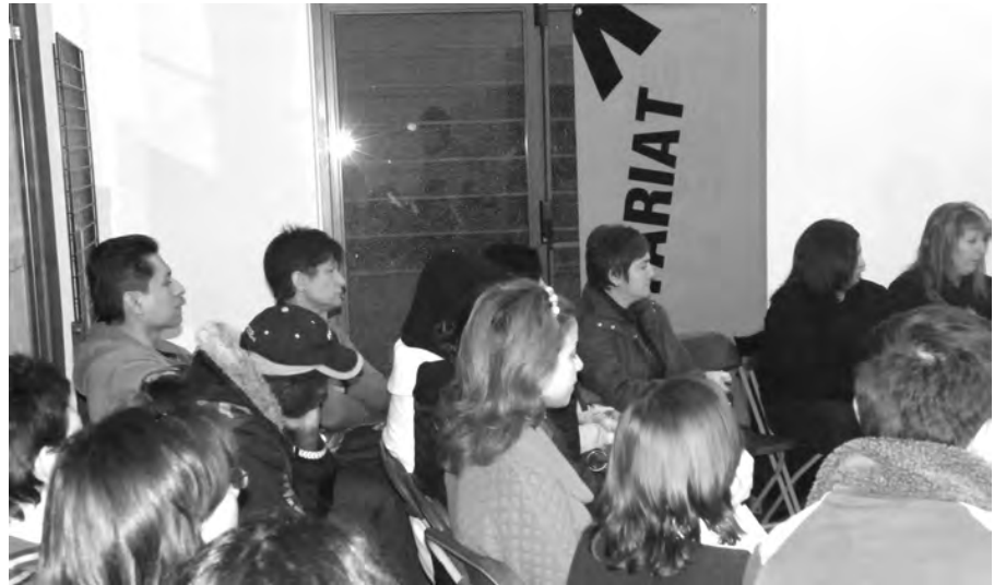
L'inici de la nova edició del "Voluntariat per la llengua".

El passat 21 de novembre es va donar inici a la nova edició del "Voluntariat per la llengua" a la Bisbal en un acte al qual van assistir molts dels membres de les noves parelles lingüístiques que, a partir d'aquest moment, es trobaran un cop a la setmana per parlar català.