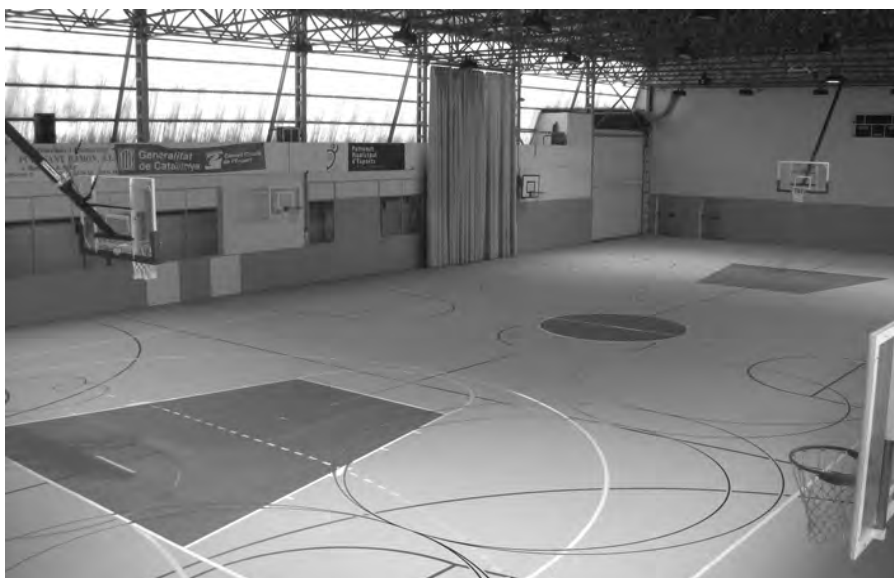
El nou terra del Pavelló d'Esports.

Així doncs, des del Patronat d'Esports podem avaluar el principi de curs com un bon començament de temporada.