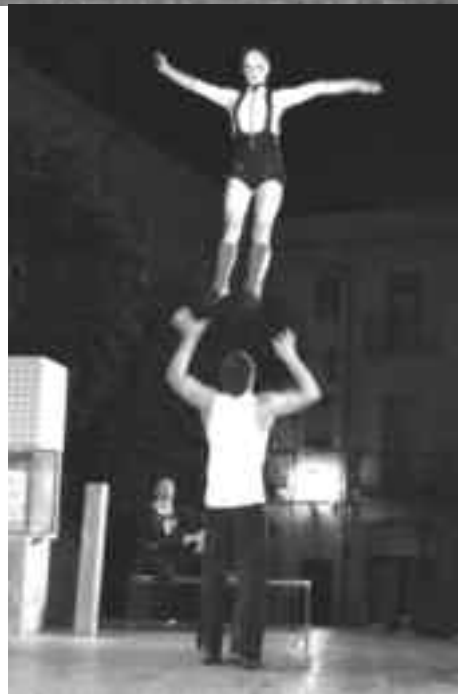
Dues de les actuacions que es van poder veure durant l'edició d'aquest 2009.

L'any que ve... Quinze anys... La plaça del poble. El poble a la plaça. La gent al carrer i el carrer de la gent. Espectacular: