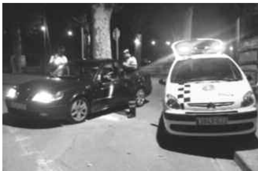
Dos policies locals duent a terme un control nocturn a la Bisbal.

La Policia Local els fa a les nits a les urbanitzacions, als polígons industrials i al nucli antic per millorar la seguretat