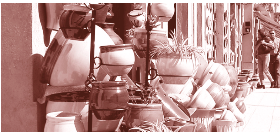
Vista dels comerços l'Aigueta.

L'Àrea de Desenvolupament Local treballarà tres grans línies d'actuació: promoció de les persones, promoció econòmica i promoció de la ciutat . Així, es responsabilitzarà de desenvolupar les accions que impliquin una promoció de la ciutat, ja sigui des de l'àmbit de les persones com l'econòmic, impulsant nous projectes innovadors i competitius en l'àmbit local i totes aquelles accions que ajudin a promoure la Bisbal, tant a dins com a fora de la ciutat.