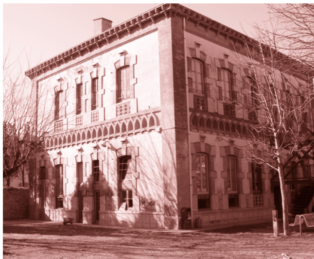
Casal de joves, a les Escoles Velles.

Conjuntament amb l'Àrea de Joventut cada any s'organitza durant el mes de desembre el Parc Infantil de Nadal (PIN), un espai dedicat als petits i on tot està pensat perquè ells gaudeixin i puguin divertir-se passant una bona estona.