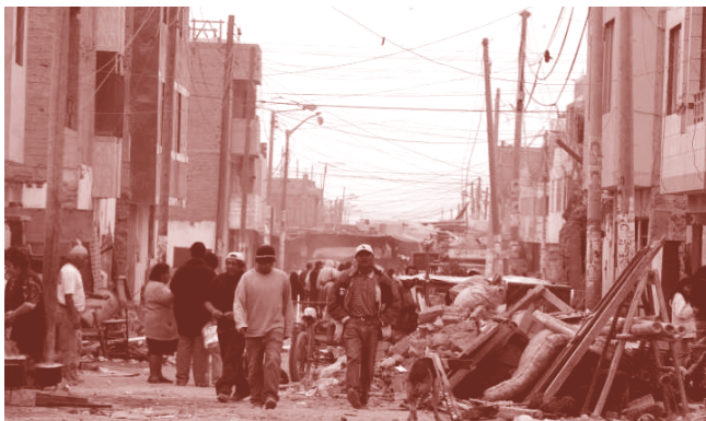
Imatge de la zona afectada pel terratrèmol de Perú.

Organitzada per una comissió de joves bisbalencs juntament amb l'Ajuntament, durant el mes de desembre s'ha pogut visitar l'exposició de l'Agenda Llatinoamericana al Mundial.