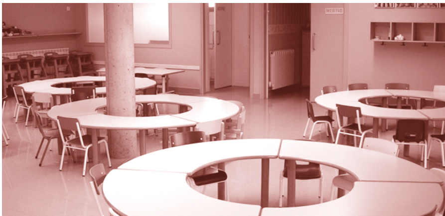
Interior de l'Escola Bressol.

El mes de febrer del 2007 es va inaugurar l'ampliació de l'escola i el curs 2007/2008 ja s'ha pogut iniciar a les noves aules –ja que l'any passat dos grups de P2 van estar ubicats tot el curs a les Escoles Velles–. Aquest curs, El Tren Petit acull 160 nens i nenes d'entre 4 mesos i 3 anys, que ocupen un total de deu aules, quatre de les quals –destinades als nadons– són fruit de l'ampliació que es va portar a terme i que permet oferir espais d'higiene i dormitoris. Així, entre les dues plantes de l'escola, hi ha repartides les aules –inclosa una de polivalent–, els espais d'higiene, un nou menjador, una nova cuina, tres dormitoris i diversos espais d'emmagatzematge, així com espais de joc interiors i exteriors perquè els infants bisbalencs gaudeixin mentre aprenen.