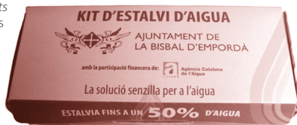
Kit d'estalvi d'aigua.

forma gratuïta uns kits d'estalvi d'aigua. Les famílies interessades, que es comprometin a instal·lar aquests dispositius en les aixetes de la cuina, lavabo i dutxa de casa seva, poden adreçar-se a les oficines de l'Àrea de Medi Ambient.