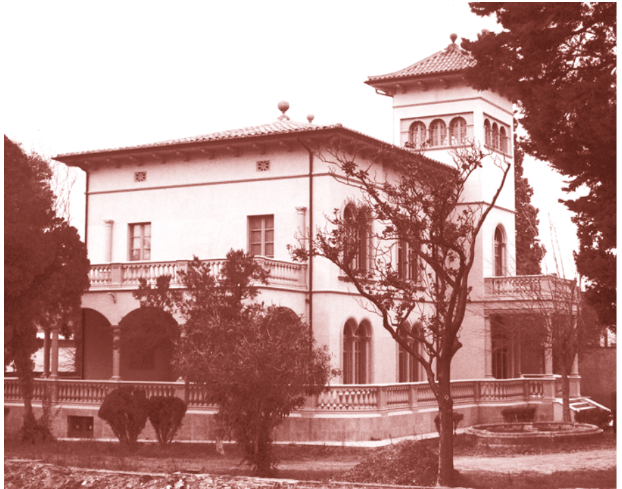
Imatge de Torre Maria.

Des de l'Oficina de Turisme, situada al castell medieval, s'han estat realitzant diferents accions de promoció i dinamització turística de la Bisbal, entre les quals podem destacar les visites guiades a escolars i a grups per mostrar el patrimoni cultural i el potencial de l'artesania ceramista de la població.