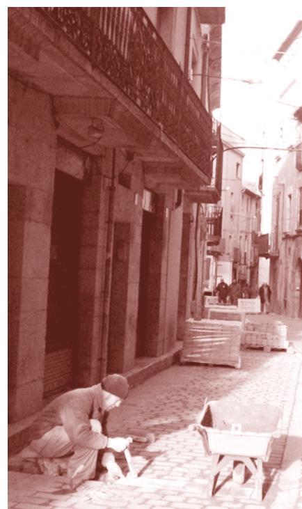
Obres al carrer del Raval.

Una via verda paral·lela, que tindrà continuïtat fins al Castell d'Empordà, serà habilitada per fer-hi un passeig a peu, en bicicleta o amb patins. La gran zona d'aparcament, a banda d'oferir pàrquing a cotxes i autocars, genera un espai per a activitats esportives i culturals. L'aparcament i el vial ocupen un espai de 4.500 m 2 .