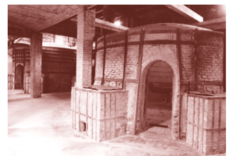
Detall de l'interior del Museu.

Més endavant, en una segona fase, es completarà la reforma del nou accés al Museu, entrada que s'ha de convertir en un dels seus principals reclams. Actualment, el solar on està situat l'equipament és gairebé interior respecte la via pública, però quan la transformació estigui totalment enllestida el front del museu superarà els 30 metres.