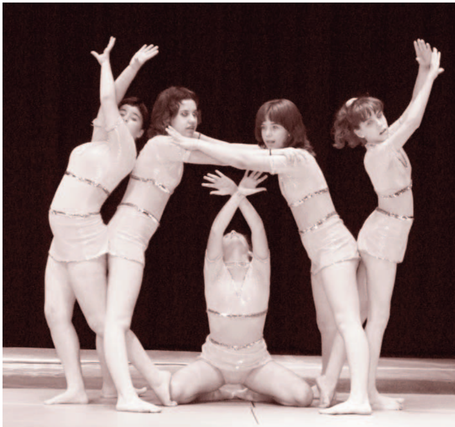
Les nenes participants a les finals de gimnàstica rítmica

D'altra banda, es va portar a terme la cloenda de gimnàstica del Patronat d'Esports al Mundial, on tots els nens i les nenes de l'escola esportiva van poder exhibir la feina duta a terme durant el curs 07/08, i van fer gaudir de l'espectacle a tots els assistents.