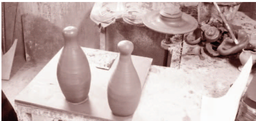
Les bitlles guardiola, un dels nous dissenys creats per al projecte

El projecte Oficis Singulares neix arran de la iniciativa d'Artesania Catalunya, un organisme de la Generalitat que acredita, informa i promou l'autenticitat de l'activitat artesana catalana. Un dels objectius estratègics és desenvolupar la "marca" d'artesanía catalana i, en aquest sentit, la ceràmica de la Bisbal d'Empordà ha estat reconeguda com a ofici singular. El projecte reconeix la identitat d'alguns oficis que ens són propis, oficis i productes únics que estan molt vinculats a la població o la demarcació dels quals són originals. Aquests productes depenen del medi geogràfic en què es realitza l'extracció de la matèria primera, la transformació i l'elaboració del producte final.