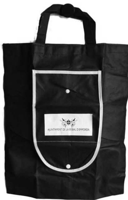
Bossa de roba que distribueix l'Ajuntament

L'Ajuntament de la Bisbal està interessat a impulsar accions dirigides a la defensa del medi ambient en matèria de residus, estalvi energètic, consum d'aigua, etc. Per això, tenint en compte les polítiques i accions que impulsa la Fundació Catalana per a la Prevenció de Residus i el Consum Responsable, s'ha aprovat un conveni de col·laboració entre l'Ajuntament de la Bisbal d'Empordà i aquest ens.