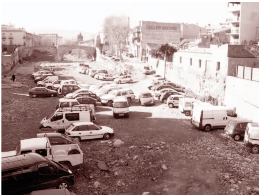
La imatge dels cotxes aparcats a la llera del riu Daró desapareixerà

Paral·lelament, amb motiu de la desaparició de places d'aparcament gratuïtes quan