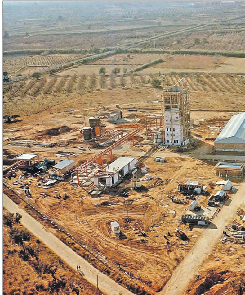
Terreno de la empresa con la planta de Styropor en construcción.