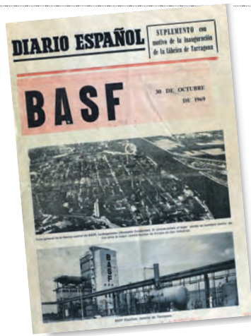
► Portada del suplemento del 'Diario Español' de la época con la noticia sobre la inauguración de la BASF en Tarragona e información en páginas interiores.