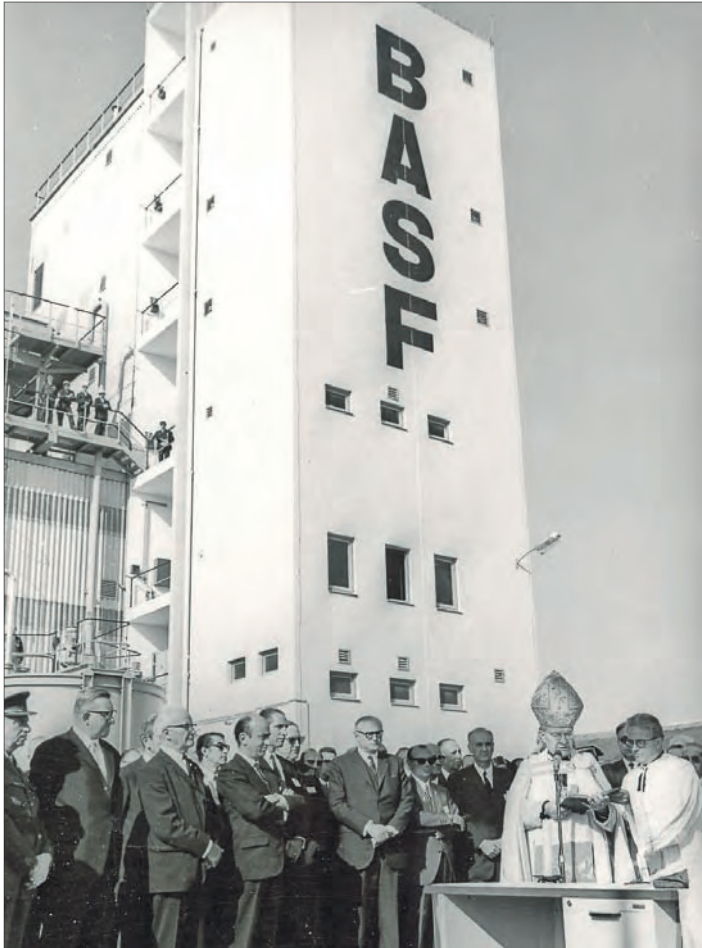
El Obispo, junto con las autoridades, inaugurando la primera planta a BASF en Tarragona.