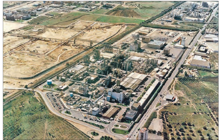
► El antes y el después de la empresa desde 1969 hasta la actualidad.

●● Construcción de la incineradora de Constantí con tecnología BASF y del Rack Dixquímics que conecta el Polígono Sur y el Puerto de Tarragona.