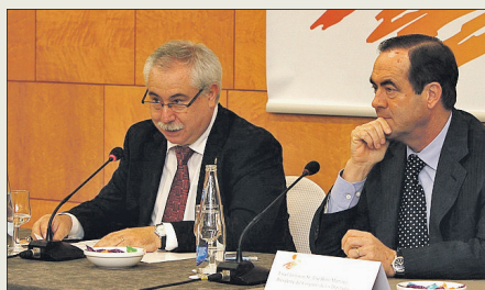
► El alcalde de Reus, Lluís Miquel Pérez, y el presidente del Congreso, José Bono.