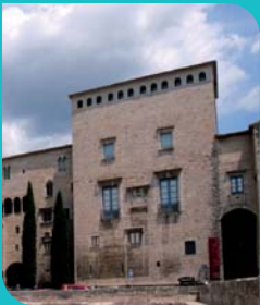
Museu d'Art de Girona Palau Episcopal Pujada de la Catedral, 12 Tel. 972 20 38 34 www.museumart.com