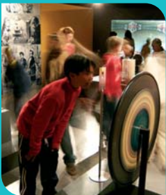
Museu del Cinema Carrer Sèquia, 1 Tel. 972 41 27 77 www.museudelcinema.cat