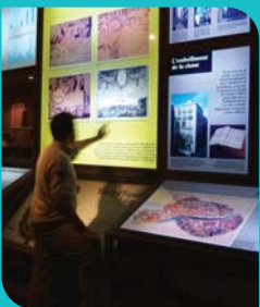
Museu d'Història de la Ciutat Carrer de la Força, 27 Tel. 972 22 22 29 www.ajuntament.gi/museuciutat