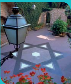
Museu d'Història dels Jueus Carrer de la Força, 8 Tel. 972 21 67 61 www.ajuntament.gi/call