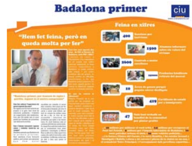
Boletín trimestral Partido "Convergència i Unió".