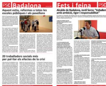
Boletín bimestral Partido Socialista.

Federaciones, asociaciones, gremios y empresas pueden usar este servicio para dar a conocer periódicamente a sus clientes y asociados la actualidad, novedades, y servicios que ofrecen. Ejemplos: