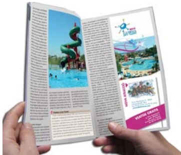
Publlirreportaje Illa Fantasia

Los publlirreportajes son una de las vertientes de la publicidad dónde el objetivo principal no es tanto el vender un producto específico, sino el de vender y dar prestigio a una empresa, es decir, una marca. El TOT, ofrece a nuestros clientes la posibilidad de hacer uso del servicio de publlirreportajes comerciales genéricos dónde el cliente decide el contenido, la forma y la sección dentro de la revista que mejor se adecue a su negocio. Este servicio está al alcance de todas las empresas, asociaciones, federaciones, etc. Ejemplos: