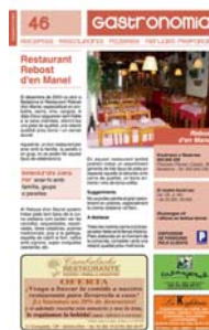
Boletín "Federació Empresarial de Badalona".