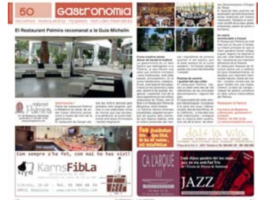
Publlirreportaje Restaurante Palmira