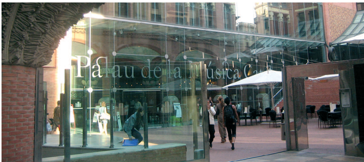
Imatge exterior del Palau de la Música Catalana

Estem parlant d'un dels patrimonis catalans més rellevants. El Palau és més que un edifici emblemàtic, l'Orfeó és un referent de la societat civil cultural; i en canvi, la seva política ha estat més pensada en la pedra i els grans esdeveniments internacionals que en la cultura del país.