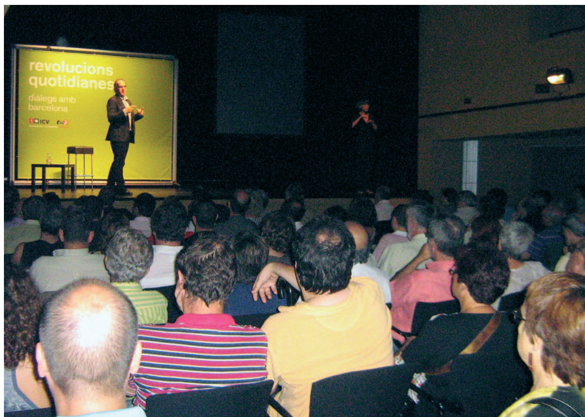
El Centre Artesà Tradicionari es va omplir de militants i simpatitzants d'ICV per escoltar Gomà

Gomà va declarar que "no neguem l'existència de problemes a la ciutat, però no compartim en absolut la diagnosi que Barcelona té un espai públic completament degradat; el que cal és reforçar el diàleg i l'acció comunitària".