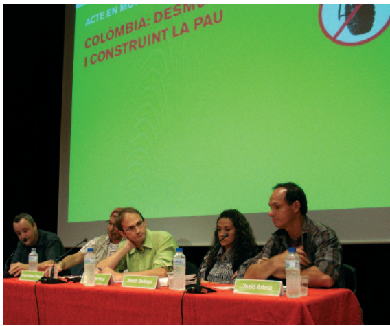
Imatge de la xerrada