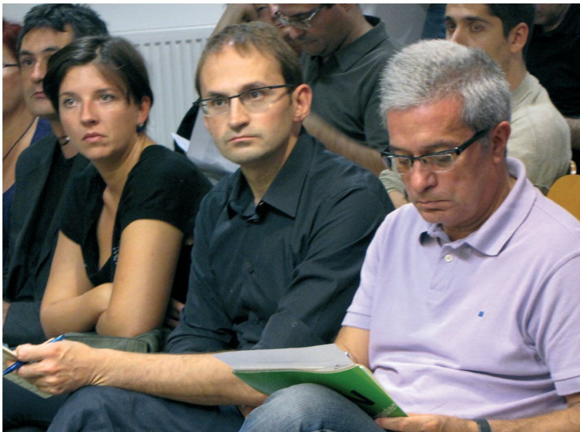
Joan Saura, Joan Herrera i Laia Ortiz, el passat 3 d'octubre, en el Consell Nacional d'ICV

El període de presentació de candidatures es va obrir el passat 5 d'octubre i es tancarà el proper dijous 22 d'octubre. Per poder presentar-se es necessiten 50 avals de companys i companyes de l'organització.