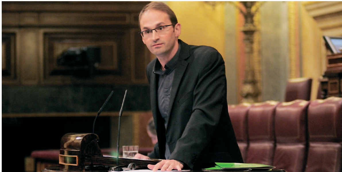
El diputat d'ICV, Joan Herrera, durant una intervenció al Congrés de Diputats

El passat 26 de setembre el govern de l'Estat va presentar els Pressupostos Generals de l'Estat per a l'any 2010, que inclouen l'anunciada reforma fiscal que el president havia estat presentant sense concrecions durant els mesos d'estiu.