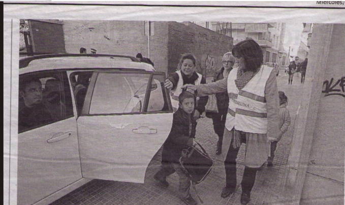
Una madre, ataviada con chaleco fluorescente, se dispone a recoger a un niño en la calle del Col·legi. HERNÁN ARÓTEGUI