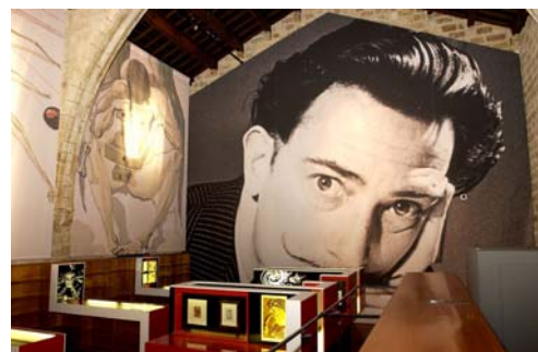
Dalí, una vida de llibre

Destaquen, a més, les exposicions següents: Hermenegildo Miralles, enquadernador (20.04.05–18.06.05) i Col·leccions privades, llibres singulars (15.11.05 – 15.01.06)