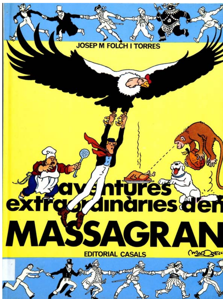
Portada de Les aventures extraordinàries d'en Massagran dibuixat per J. M. Madorell

Durant el 2005 han ingressat diversos fons de documents gràfics, d'entre els quals destaca la donació de Josep M. Madorell, composta d'originals, esbossos, guions, dissenys de pàgines, etc. del dibuixant de còmics, referent català de la "línia clara".