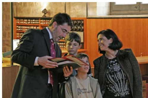
Visitants a la Jornada de Portes Obertes de Sant Jordi 2005

Les jornades de Portes Obertes s'han celebrat el 23 d'abril, Sant Jordi, i l'11 de novembre, en el marc del Festival de Cultura del Raval. En conjunt han passat per la BC en els dos dies unes 3.750 persones.