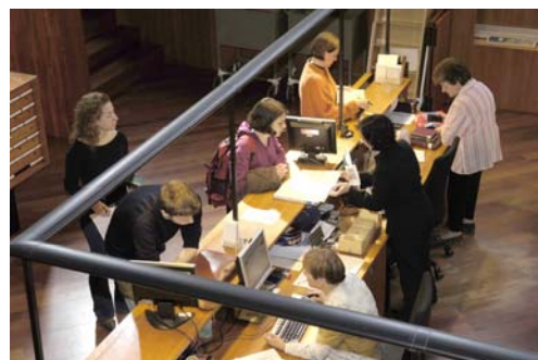
Atenció als usuaris

D'altra banda, des de març de 2005 s'han portat a terme trobades periòdiques de caràcter bimestral entre la directora i el personal de la Biblioteca ( Espai de Trobada ) amb l'objectiu de potenciar la comunicació en totes les direccions a la BC. Així mateix, s'ha continuat l'edició del butlletí electrònic de comunicació interna ( Comunicació a la BC ) iniciada el 2004.