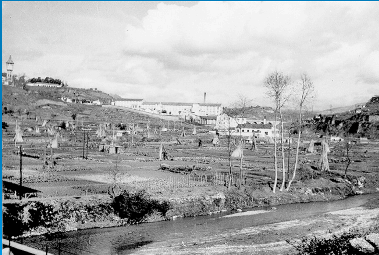
L'horta Vella i al fons ca la Daniela i el molí Xic. Autor: Ramon Casanovas, 1935 (UES)

L'ocupació antiga de l'entorn del riu fa segles que va fer desaparèixer la vegetació fluvial.