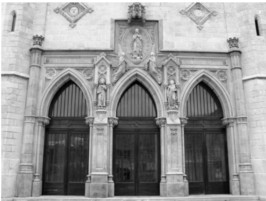
Portics de la façana de l'església de Santa Maria obra de Joan Martorell.