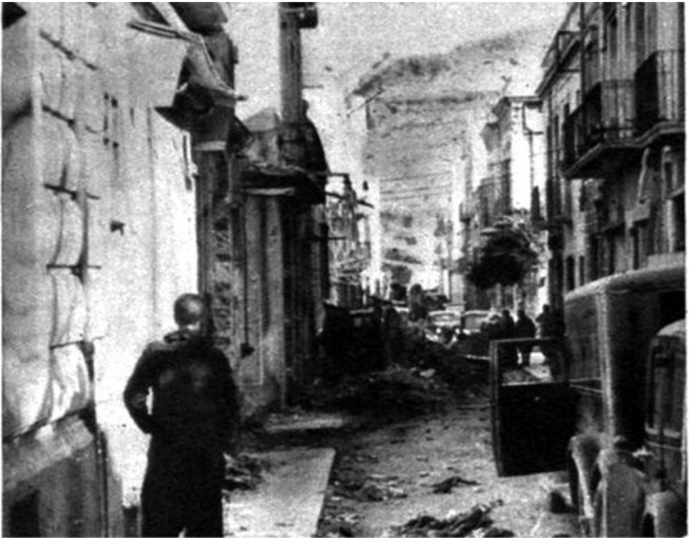
Fotografia del carrer Unió de Portbou (en direcció a Méndez Núñez), a finals de febrer de 1939.

Passeig de la Sardana 11, 17497 Portbou (Girona) Telèfon/Fax (00-34) 972 390 712 portdeportbou@telefonica.net