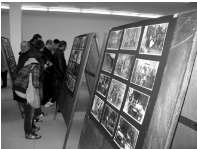
Imatge de l'exposició de fotografies antigues de Portbou de l'arxiu M. Roman.

- 29 de desembre. 500 fotografies antigues de Portbou veuen la llum. L'arxiu de M. Roman, el més important de