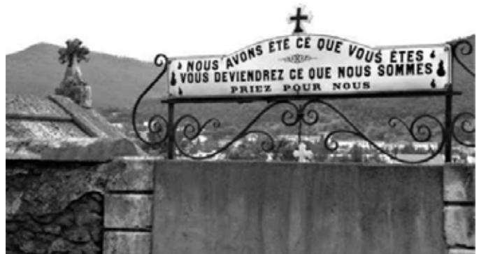
La benvinguda que es llegeix a l'entrada d'aquest cementiri francès esdevé ("Nosaltres hem estat això que vosaltres sou. Vosaltres esdevindreu això que nosaltres som"), un epitafi col·lectiu per a la globalitat dels seus estadants.

A la tomba del cèlebre transformista italià Leopoldo Fregoli (1936) es llegeix: "Aquí dins he dut a terme la meva última transformació". Paraules de difunt atribuïdes, segons la llegenda, al cineasta Alfred Hitchcock (1980): "Això és el que passa als noiets dolents"; i al compositor Johann Sebastian Bach (1750): "Des d'aquí no se m'acudeix cap fuga". "Que baixi el teló, la farsa ha acabat", sentencià l'escriptor François Rabelais (1553). A la tomba del genial humorista Miguel Gila