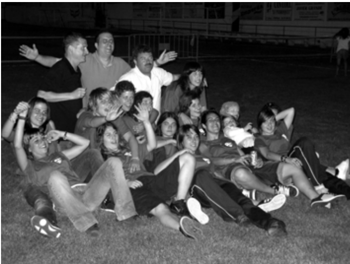
L'equip femení del Club Esportiu Portbou guanyador del grup 6 de Segona Divisió.