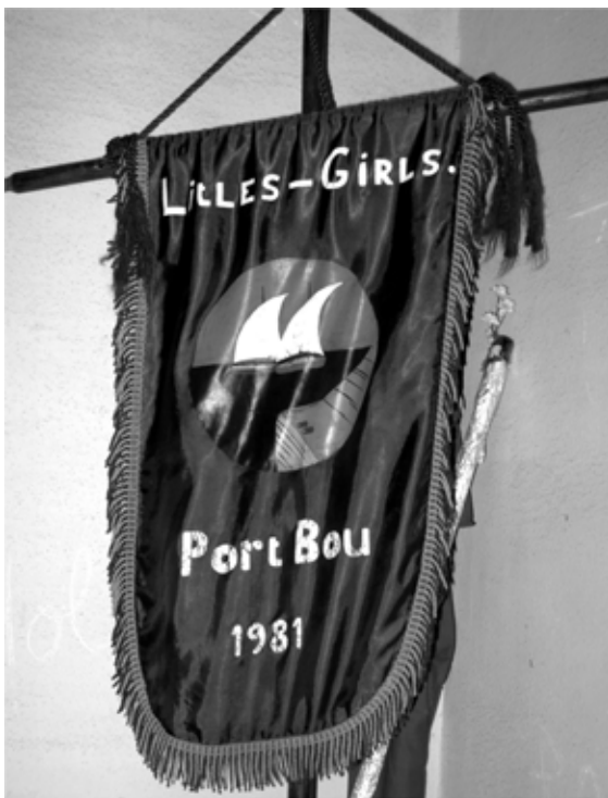
L'estandart de les Litles-Girls (majorets). Una de les activitats organitzades per l'associació.

L'associació Mestresses de Casa de Portbou, es va constituir el 15 de febrer de l'any 1980 com a entitat sense ànim de lucre i per a la promoció de les dones del poble.