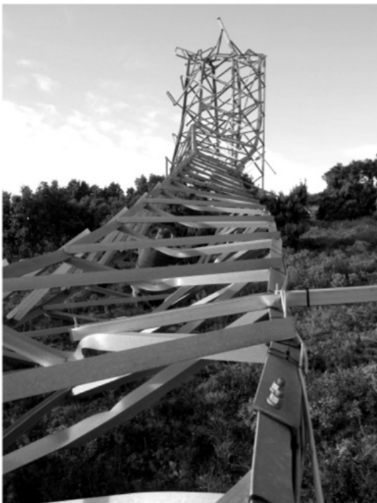
La torre de mesura de vent del Pla de Ras a terra per la tremuntana.