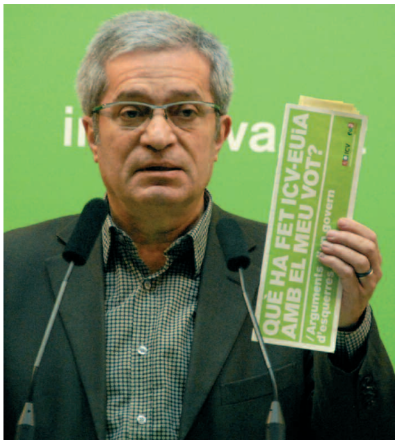
Joan Saura amb el llibre que es va presentar

El president d'ICV també va destacar que el Govern d'Entesa “ha valgut la pena” i va esmentar entre l'obra de govern: el nou Estatut, el nou model de finançament per a Catalunya –amb un increment per sobre dels 3.600 milions d'euros–, la capacitat d'integrar en els darrers anys 700.000 persones immigrants, la reducció dels accidents laborals, la lluita contra el canvi climàtic, el respecte per la biodiversitat, la millora de la qualitat de l'aire, el gran augment en la construcció d'habitatges de protecció oficial i l'impuls d'una nova cultura de l'aigua que ha convertit Catalunya en la comunitat autònoma on s'estalvia més aigua.