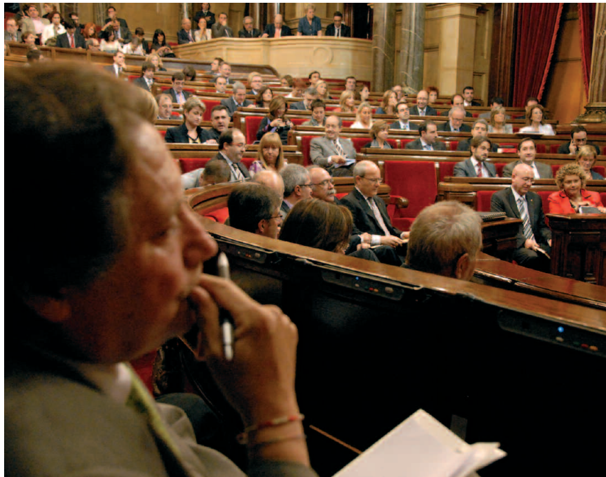
El president del grup parlamentari d'ICV-EUiA, Jaume Bosch

ICV-EUiA ha treballat amb voluntat de consens per avançar en: - els drets dels electors com a eix principal de la llei, - un model electoral més proporcional i amb més presència del territori, on es respectés el principi d'igualtat de vot; - mesures de foment de la participació i transparència en els processos electorals; - regles de limitació i control de la despesa electoral, - un debat polític democràtic, plural i de qualitat en els mitjans de comunicació, especialment en el període electoral. ICV-EUiA va manifestar el seu acord per desenvolupar 42 de les 50 mesures de l'Informe de la Comissió d'Experts. Sobre les relatives al sistema electoral, ICV-EUiA va tenir un posicio-