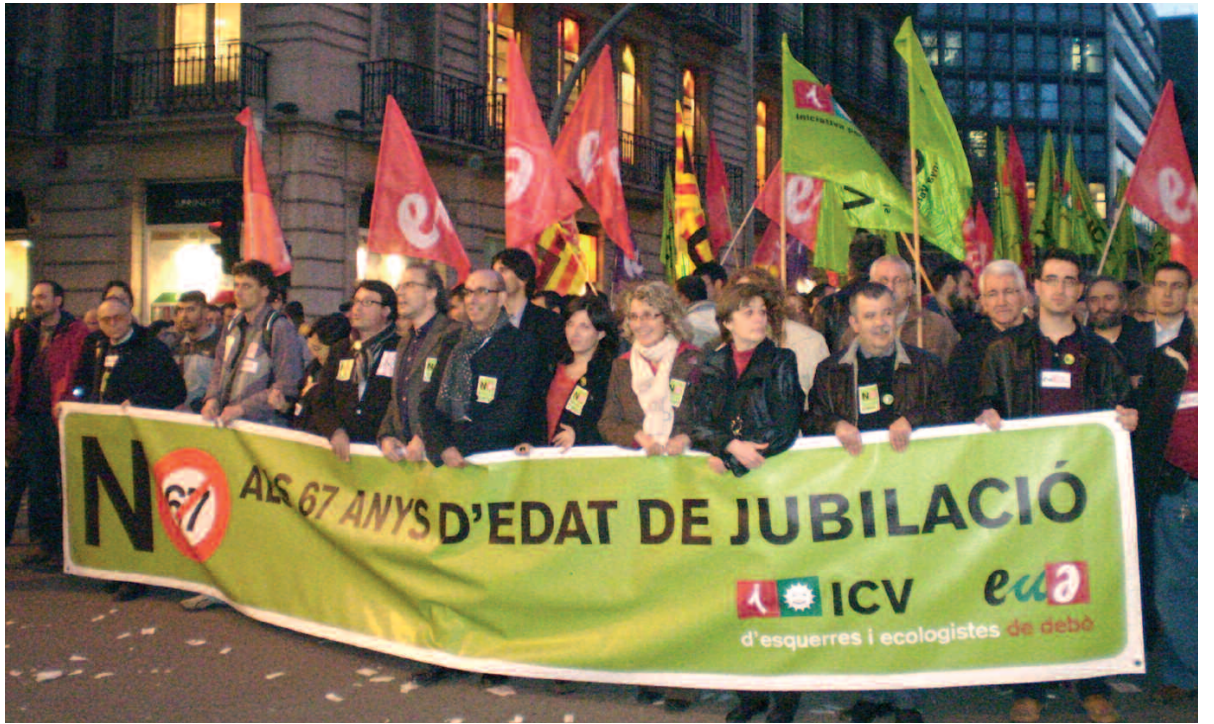
Capçalera d'ICV-EUiA a la manifestació del 23 de febrer a Barcelona en protesta contra la mesura de retardar la jubilació als 67 anys