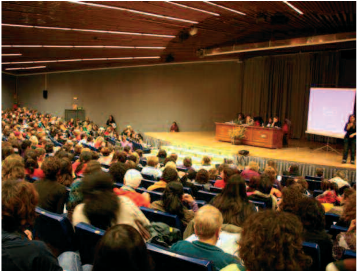
Imatge de les III Jornades Feministes Estamentals, on Dones amb Iniciativa hi va participar

Las jornadas feministas celebradas recientemente en Granada han significado una dosis de debate y encuentros importantes para el movimiento feminista. Siempre se han de valorar estos encuentros como un éxito, por la asistencia y puesta en común de nuestros haberes y saberes. Pero también han tenido puntos débiles, pienso que el programa debía abarcar la diversidad social de las mujeres, la situación actual, marcada por una crisis con fuerte carácter de género y los ejes de futuro del debate feminista. Dones amb Iniciativa estuvo presente en las jornadas, aportó un buen trabajo y debate, siendo una de las ponencias más concurridas. El buen rollo que se llevó a Granada, fue una continuación del que se vive en Dones amb Iniciativa y eso siempre da como resultado un éxito. ▸