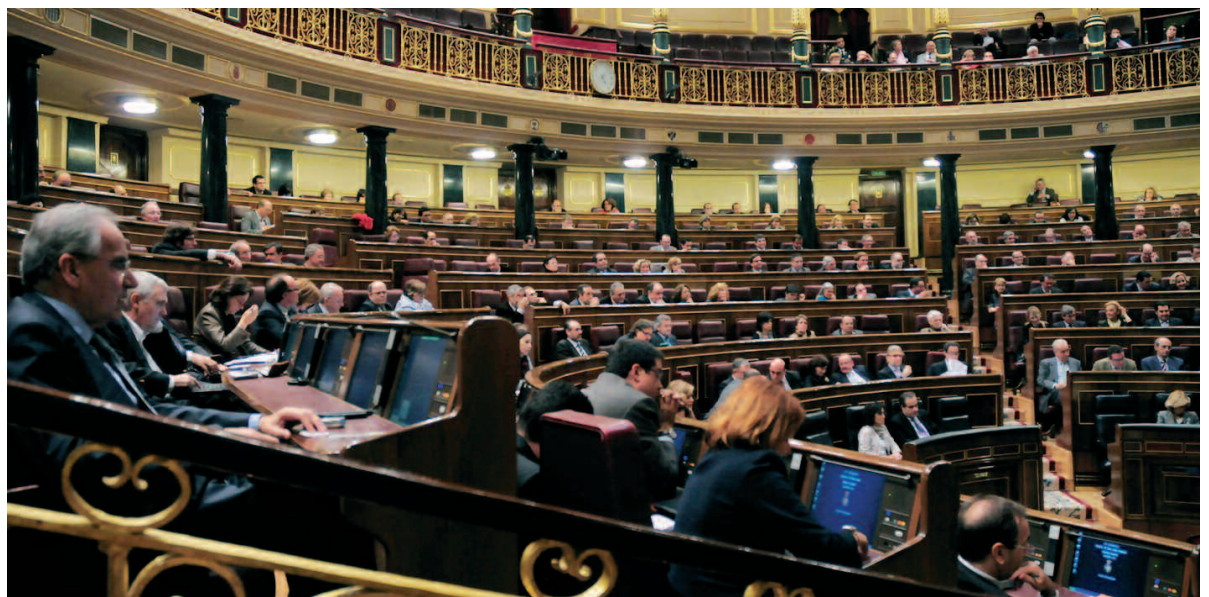
Imatge del Congrés dels Diputats