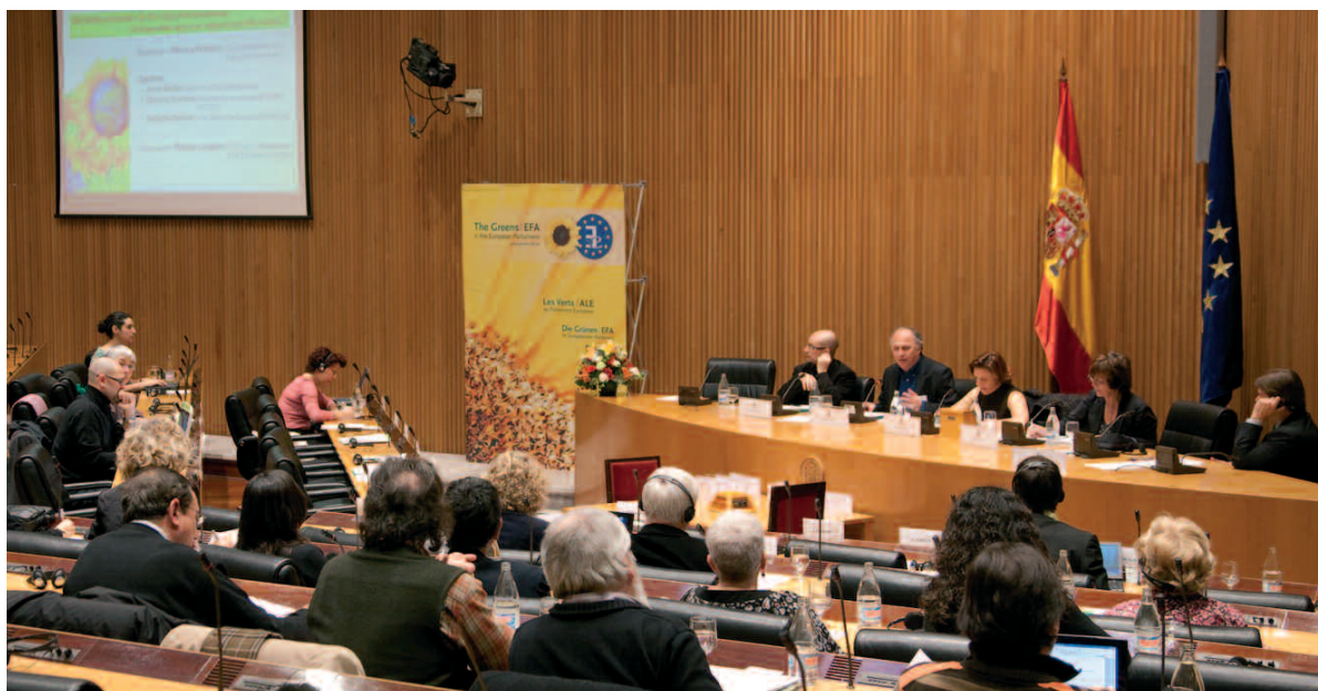
Imatge de la trobada del grup parlamentari dels Verds Europeus, al Congrés dels Diputats