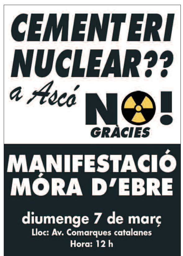
Cartell de la Coordinadora Anticementiri Nuclear de Catalunya

Per donar resposta a aquesta situació, Iniciativa per Catalunya Verds ha impulsat una resolució pactada amb els tres grups que donen suport al Govern d'Esquerres per actualitzar el rebuig de la Cambra catalana al cementiri nuclear. El text de la resolució pactada pels tres grups que donen suport al govern de la Generalitat expressa el "suport a la decisió del govern de rebutjar la instal·lació a Catalunya d'un magatzem temporal centralitzat de residus nuclears".