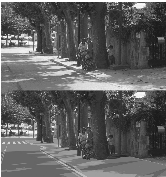
Imatges 1 i 2. Carrer dins el camí escolar d'un centre a Alella. Situació actual i proposta de mesura.