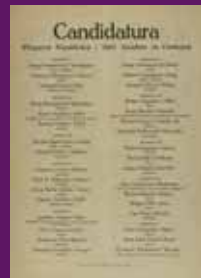
Abril 1931 Octaveta amb el nom de tots els candidats municipals d'Esquerra i la USC a Barcelona.