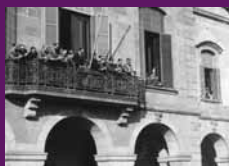
Barcelona, 12 juny 1934 Lluís Companys ademat pels rabassaires que es manifesten davant del Parlament de Catalunya després que el Tribunal de Garanties Constitucionals revocà la Llei de Contractes de Conces.