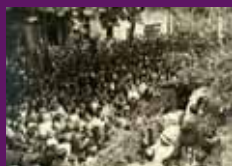
Arbúcies, 31 maig 1934 Lluís Companys s'adreça als assistents a un acte d'homenatge a Francesc Macià.