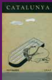
Novembre 1940 La revista Catalunya, editada pels catalans de Buenos Aires, amb una portada «Homenaje al asesinato de Lluís Companys en un número monográfico dedicado al presidente marit».