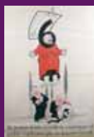
Gener 1936 Cartel·la editat per la Lliga que ironitza sobre els Fets del Sis d'Octubre i la fienda que els hi portava fer a Carles Pi i Sunyer i Pere Corominas, els dirigents d'Esquerres que assumiren la direcció del partit durant l'empresonament de Companys.

El Parlament de Catalunya torna a funcionar i Companys és ratificat com a president de la Generalitat. La Catalunya autònoma reprèn el pols de la normalitat i esdevé fins el 18 de juliol «l'oasi de la República», en comparació amb l'allau de violència de la resta de l'Estat.