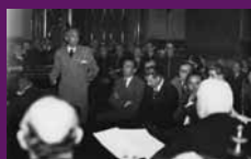
Madrid, 27 maig 1935 Lluís Companys intervé durant el judici pel·l Fets del Sis d'Octubre. Al seu costat els altres membres del govern: Joan Lluhi, Pere Mestre, Joan Comorera, Ventura Gassol.