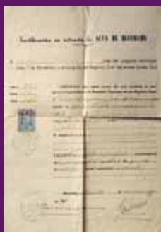
30 novembre 1940 Certificació en extracte d'Acta de defunció on es recull la causa de mort del president Companys: «hemorragia interna traumàtica».