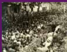
Arbúcies, 31 maig 1934 Lluís Companys s'adreça als assistents a un acte d'homenatge a Francesc Macià.