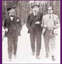
Madrid, 1920 Lluís Companys, Salvador Seguí i Noi del Surocc i Francisco Gómez Hidalgo, passejant per un jardí públic.