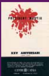
15 octubre 1965 Homenatge del Centre Català de Caracas en el 25è aniversari de l'assassinament del president màrtir.