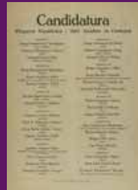
Abril 1931 Octaveta amb el nom de tots els candidats municipals d'Esquerra i la USC a Barcelona.