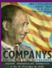
Gener 1966 La revista Som, editada a França pel Front Nacional de Catalunya, en un monogràfic dedicat a Lluís Companys.