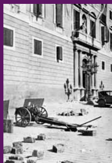
Barcelona, 7 octubre 1934 El balló del Palau de la Generalitat amb els desperfectes causats per les canonades de l'exèrcit del dia anterior.