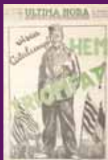
17 febrer 1936 La primera pàgina d'Última Hora celebra el triomf electoral.