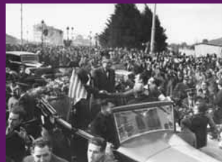
Barcelona, 1 març 1936 L'entrada a Barcelona, a l'ajudada de la plaça d'Alcàzar Zamora —factual plaça de Francesc Macià—, amb Lluís Companys i l'alcaldes Carles Pi i Sunyer.