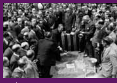
Barcelona, 1 maig 1934 Lluís Companys col·loca la primera pedra del Monument a Francesc Layret.