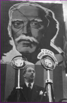
Barcelona, 27 desembre 1936 Lluís Companys en el mitjà d'Esquerra en commemoració del tercer aniversari de la mort de Francesc Macià, celebrat al Palau de Belles Arts.