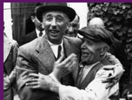
Castellar del Vallès, 16 maig 1936 Lluís Companys en una visita pel País s'atura a saludar a «Tavi Bruguera» un vell rabassaire qualificat pel president de la Generalitat com «el més antic republicà de Castellar i un dels millors amics que jo he tingut».