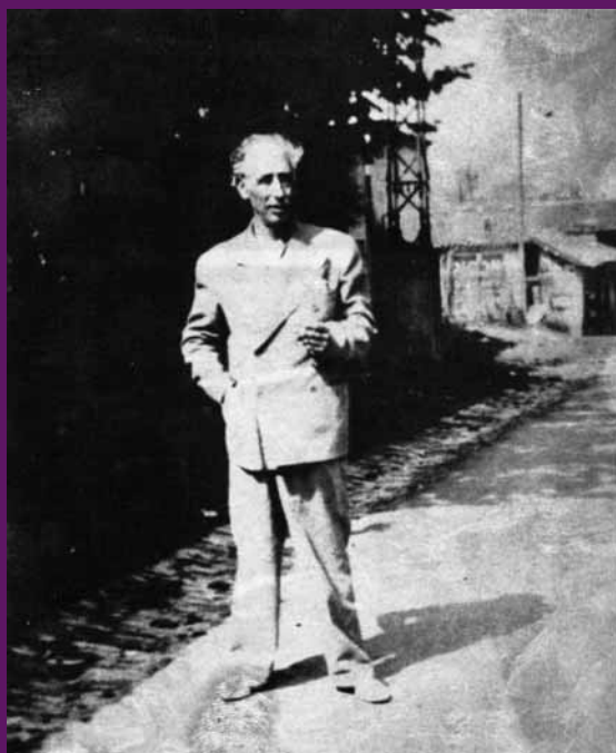
Hendaya, agost 1940 Fotografia de Lluís Companys feta per l'agent de la policia espanyola Pedro Urraca, al pas de la frontera, com a prova d'haver-lo entregat viu.

Tot i l'evident perill personal que comporta la nova situació, Companys decideix restar a França per tal de no separar-se del seu fill malalt, refugiant-se a la població bretona de la Baule. Allí, el 13 d'agost de 1940, el deté la policia militar alemanya i el lliura a la policia espanyola que el segresta en una conducció il·legal.