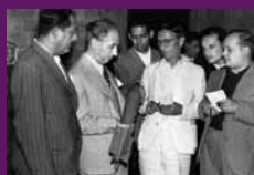
Barcelona, 13 agost 1936 El president Companys mostra als periodistes, al Palau de la Generalitat, la primera bomba d'aviació, de 12 quilos, fabricada a Catalunya.