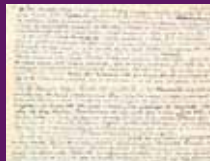
15 octubre 1940 Testament polític manuscrit per Lluís Companys.