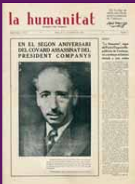
15 octubre 1942 La Humanitat, editada per Esquerra a Mèxic.