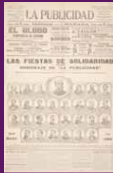
20 maig 1906 El diari republicà La Publicidad ret homenatge als diputats de Solidaritat Catalana que van combatre al Parlament espanyol la Llei de Jurisdiccions.

Acabada l'etapa estudiantil, el compromís polític el porta a iniciar una activa militància, que el fa passar per diferents partits i plataformes electorals com ara Unió Republicana, Solidaritat Catalana, Esquerra Catalana i finalment, el 1910, la Unió Federal Nacionalista Republicana liderada per Josep Maria Vallès i Ribot, Pere Coromines i Joaquim Lluhi i Rissech, entre d'altres, on Companys n'esdevé president de la joventut .