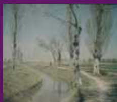
Molins de Marçà, 1 abril 1929 El canal d'Urgell en una de les primeres fotografies a color de l'Esporca. Generar / CCC