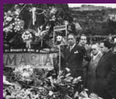
Barcelona, 21 gener 1934 El nou president Lluís Companys ret homenatge al president Macià davant la seva tomba.