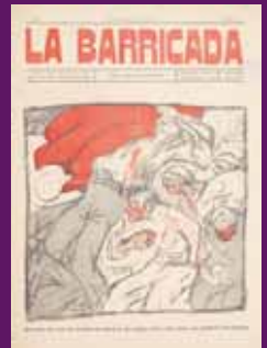
22 març 1912 Un exemple de la primera època de La Barricada , setmanari impulsat per Francesc Layret.