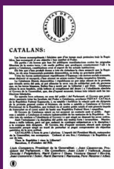
6 octubre 1934 Bah de la proclamació de l'Estat Català.