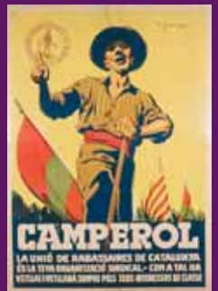
circa 1936 Carta de la Unió de Rabassaires.