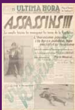
22 juliol 1936 Portada d'Última Hora que recull la victòria republicana sobre els revoltats feixistes a Catalunya. AJCER