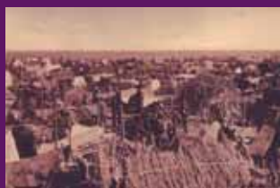
Sant Cebrià de Rosselló, febrer 1939 Un dels camps de refugiats instal·lats a les platges rosselloneses.