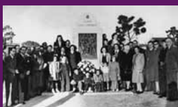
Montevideo, circa 1950 Homenatge al president màrtir en el monument que la capital de l'Uruguai li dedica a la plaça que porta el seu nom, inaugurada el 1944.