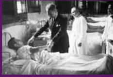
Barcelona, 1936 El president Companys visita ferits de guerra a l'Hospital de Sant Pau.