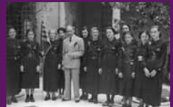
Barcelona, 5 juny 1937 El president Companys regala un banderí a la «Secció femenina Lluís Companys» del Centre Republicà Català del Districte IV, d'Esquerra de Barcelona.