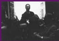
Barcelona, 14 abril 1931 Lluís Companys entra a l'Ajuntament un cop confirmada la victòria a les eleccions municipals.