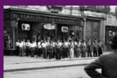
Barcelona, 6 octubre 1934 Escorta de les detencions davant el Palau de la Virreina.