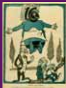
14 febrer 1936 Resposta de L'Esquella de la Torrada al cartell de la Lliga, que ironitza sobre la fienda de Francesc Cambó i Alejandro Lerroux per explicar la derrota electoral.