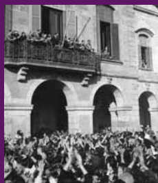
Barcelona, 12 juny 1934 Lluís Companys ademat pels rabassaires que es manifesten davant del Parlament de Catalunya després que el Tribunal de Garanties Constitucionals revocà la Llei de Contractes de Conces.