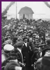
Castelldefels, 1 març 1936 Arribada al baixador de Castelldefels, deixen el tren i continuen la ruta fins Barcelona per carretera, a la imatge a més de Lluís Companys apareixen Ventura Gassó i Joan Lluís.