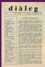
Novembre 1965 Diàleg, la revista d'Unitat Democràtica de Catalunya editada a París, recorda a Lluís Companys en el 25è aniversari de l'assassinament.