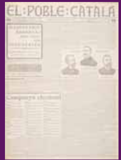
18 abril 1907 El diari republicà El Poble Català dona suport als candidats de Solidaritat Catalana, entre els quals el coronel Francesc Macià.