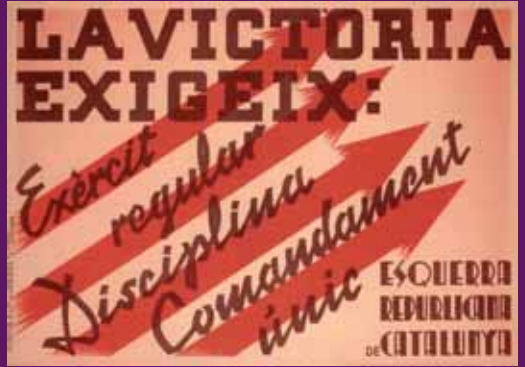
1936 Cartell d'Esquerra Republicana de Catalunya. ASC