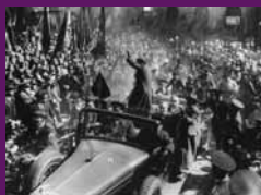
Barcelona, 1 març 1936 Arribada triomfal a la plaça de la República, Festival a la plaça de Sant Jaume.