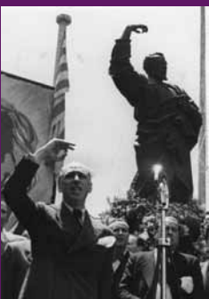
Barcelona, 7 juny 1936-1937 Lluís Companys en la commemoració del Corpus de sang davant l'estàtua de Pau Claris.