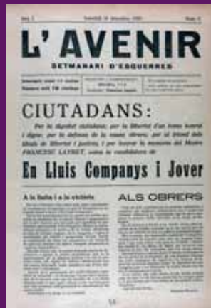
18 desembre 1920 L'Avenc crida a votar per Lluís Companys en les eleccions al Congrés celebrades per cobrir la vacant produïda per l'assassinat de Francesc Layret, fundador d'aquest setmanari d'esquerres sabadellenc.