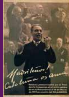
Març 1937 Cartell editat pel Comissariat de Propaganda de la Generalitat de Catalunya. Josep Maria Segura / AISC-Fons Companys