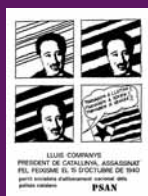
15 octubre 1975 Octaveta editada pel Partit Socialista d'Alliberament Nacional, a l'interior.