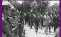
Alcanyis, 15 juliol 1937 El president Companys passant revista a les tropes republicanes en una visita al front d'Aragó. Lluís Torrens / AGA