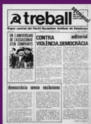
11 octubre 1976 Treball, òrgan central del Partit Socialista Unificat de Catalunya.