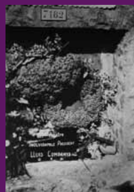
Barcelona, 15 octubre 1942 Corona i retol posats al nínxol del president Companys, on durant tot el franquisme no hi va haver cap referència que permetés identificar-lo. Aquesta és la primera acció clandestina de reivindicació del president màrtir de la qual es conserva testimoni gràfic.