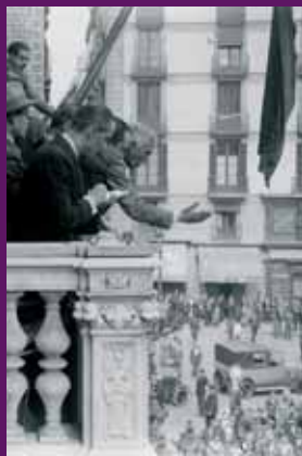
Barcelona, 14 abril 1931 Francesc Macià proclamant la República Catalana des del balcó del Palau de la Generalitat.