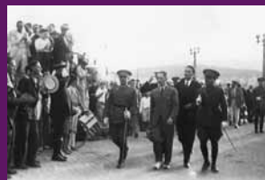
Palma, 6 juliol 1933 El ministre de Marina, Lluís Companys, durant unes maniobres militars al port, acompanyat del comandant militar de Baleares, general Francisco Franco i del comandant militar de Catalunya, general Domènec Batet.