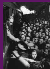
Reus, 1 març 1936 Un cop d'èxit, Lluís Companys i la resta del govern retornen en tren a Catalunya en una jornada triomfal. S'aturen a les principals estacions on el poble els aclama.