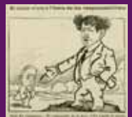
9 desembre 1922 Viçetja publicada a La Campana de Gràcia on Lluís Companys acusa el cap de la policia Miguel Arlegui de l'assassinat de Francesc Layret.