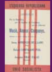
Abril 1931 Octaveta de propaganda de la candidatura municipal de la coalició entre Esquerra i la USC a Barcelona.