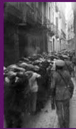
Barcelona, 1930 Columna de distingits durant la vaga general convocada per forces de l'Exèrcit.