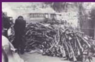
El Pertús, febrer 1939 Les armes republicanes s'amunteguen a la banda francesa de la frontera.