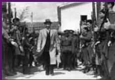
Sant Cugat del Valles, març 1937 El president Companys passa revista als nous reclutes a l'Escola militar de Pins del Valles, el nom de Sant Cugat del Valles durant la Guerra Civil.