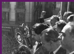
Barcelona, 1 març 1936 Lluís Companys al balcó del Palau de la Generalitat, on pronuncia la històrica frase: 'tornarem a sofrir, tornarem a lluitar, tornarem a guanyar'.