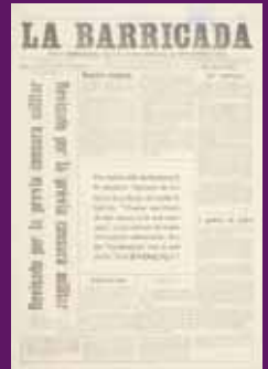
23 març 1918 En la seva segona època La Barricada apareix com a setmanari republicà-socialista, organitzat pels Joventuts Revolucionaris del Partit Republicà català.