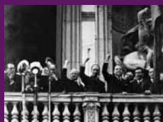
Barcelona, 8 novembre 1936 El president Companys i el cònsol de la Unió Soviètica, Vladimir Antonov Ovsienko, saluten els ciutadans que es manifesten en commemoració del 19è aniversari de la revolució russa, des del balcó del Palau de la Generalitat. L'acompanyen Joan Comorera i Jaume Aiguader.