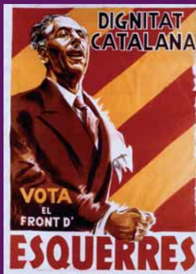
Febrer 1936 Un dels cartells de l'exitosa campanya electoral del Front d'Esquerres.