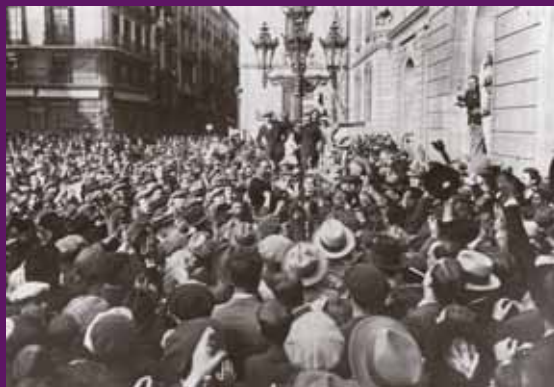
Barcelona, 14 abril 1931 Lluís Companys entra a l'Ajuntament un cop confirmada la victòria a les eleccions municipals.

El crit popular «Visca Macià, morí Cambó» simbolitza l'aval d'un poble exultant, a l'estratègia del victoriós catalanisme d'esquerres que, amb una actitud de valentia i fermesa, ha aconseguit en poques hores, una autonomia política que el catalanisme conservador de la Lliga Regionalista, portava anys demanant infructuosament a la monarquia espanyola.