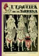
15 agost 1931 Portada de L'Esquella de la Torratxa que reflecteix el moment d'euforia per l'aprovació en referèndum de l'Estatut de Catalunya.