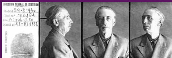
Madrid, 29 agost 1940 Fotografia policòmica de Lluís Companys amb triple foto i empremta dactilar.

El 15 d'octubre de 1940, cap a dos quarts de set del matí, al fossar de Santa Eulàlia del Castell de Montjuïc, Lluís Companys s'enfronta a l'execució amb la mateixa enteresa i valor que ha demostrat en el judici i que ha trasbalsat als propis botxins. De cara a l'escamot, format per soldats d'infanteria, rebutja que l'embenin els ulls i descalçant-se per morir trepitant terra catalana, pronuncia les seves darreres paraules: «Per Catalunya!» , que encara ressonen en l'aire fred del matí després de ser abatut. L'oficial li dona el tret de gràcia que ha de repetir. Han assassinat a Lluís Companys, el president de Catalunya. Mor un home, però neix un mite.