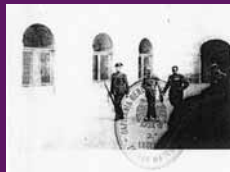
Barcelona, 14 octubre 1940 Darrera foto coneguda de Lluís Companys el dia abans del seu afusellament, al Castell de Montjuïc.