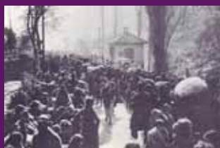
El Pertús, febrer 1939 L'èxode de la població civil.