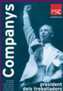
15 octubre 2005 Cartell editat pel Partit dels Socialistes de Catalunya.