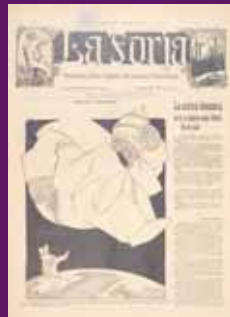
6 agost 1910 La Forja , el setmanari de la Unió Federal Nacionalista Republicana, en una portada de marcat to anticlerical.