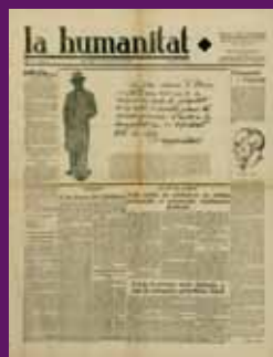
9 novembre 1931 Portada del primer exemplar de La Humanitat, dirigit per Lluís Companys.