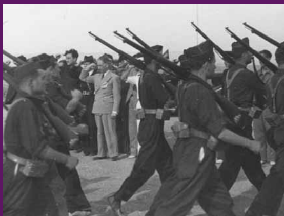
Sarriena, 15 juliol 1937 El president Companys passant revista a les tropes republicanes en una visita al front d'Aragó.

Catalunya viu un període tràgic i dramàtic, amb la pèrdua de milers de vides, als fronts i a la rereguarda. Per damunt de crítiques ineludibles en un període tan convuls és innegable que el tremp del president Companys aconsegueix que, malgrat tot, la Generalitat continuï sent la clau de volta del país.