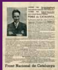
15 octubre 1944 Pasqui del Front Nacional de Catalunya editat a l'interior.