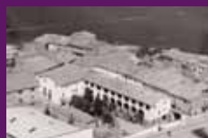
El Tarròs, circa 1975 Una imatge aèria de la finca familiar dels Companys.