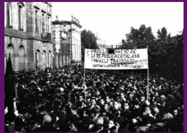
Barcelona, 12 juny 1934 Manifestació dels rabassaires davant del Parlament de Catalunya després que el Tribunal de Garanties Constitucionals revocà la Llei de Contractes de Conreu. La pancarta diu: «Proclamació de la República Catalana. A baix els traïdors de nostra terra! Lluitem i lluitarem fins la mort!».