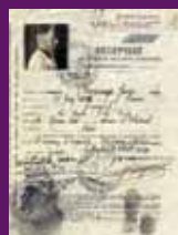
23 setembre 1939 Carta d'identitat emesa per les autoritats franceses a Lluís Companys durant la seva estada a França.