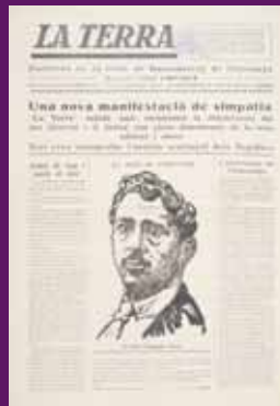
21 juny 1924 La Terra, el portaveu de la Unió de Rabassaires, fou fundada i dirigida per Lluís Companys.