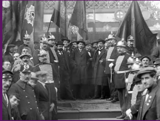
Barcelona, circa 1920 Francesc Layret, Jesus Pinya, Marcel·lí Domingo i Lluís Companys en un acte al Palau de Belles Arts.

La defensa de l'escò de Layret pel districte de Sabadell, li pertoca a Companys. Escollit diputat és alliberat i al Congrés denuncia activament el terror blanc provocat a Barcelona per la «lleide fugues» aplicada pel governador Severiano Martínez Anido i el cap de la policia Miguel Arlegui.