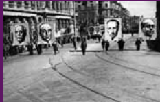
Barcelona, 28 febrer 1937 Manifestació de clausura de la setmana Pro Ejército Regular, al seu pas per la plaça de Catalunya, militants de diferents organitzacions polítiques i sindicals, porten pancartes amb els retrats de Francesc Macià, Francisco Largo Caballero, Lluís Companys i Manuel Azaña, entre altres.