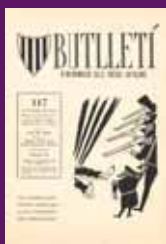
Octubre 1970 Commemoració dels 30 anys de l'assassinament de Companys en l'edició d'Infiniet dels Països Catalans editat a la ciutat mexicana de Guadalajara.