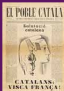
27 octubre 1939 La Generalitat a l'exili francès edita El Poble Catala .