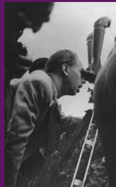
Volants d'Osca, 14 juliol 1937 El president Companys en una visita al front d'Aragó.