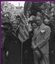
Barcelona, 7 juny 1937 Lluís Companys, amb una militant de la «Secció femenina Lluís Companys» del Centre Republicà Català del Districte IV, d'Esquerra de Barcelona, en la commemoració del Corpus de sang davant l'estàtua de Pau Claris.