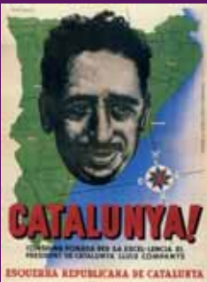
1936 Cartell d'Esquerra Republicana de Catalunya. ASC