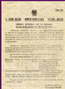
Octubre 1940 Carta de notificació del Consell de Guerra contra Lluís Companys.