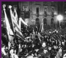
Barcelona, 10 setembre 1932 Rebuda dels parlamentaris catalans a la Plaça de Sant Jaume després de l'aprovació de l'Estatut de Catalunya al Parlament espanyol. S'ajudant des de dalt de l'automòbil: Francesc Macià, Joan Casanovas i Lluís Companys.