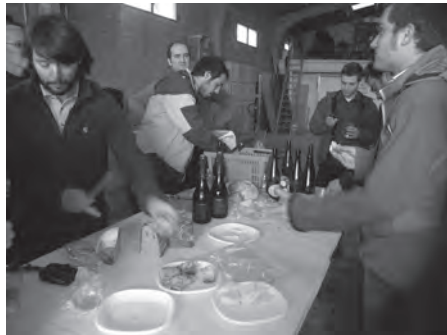
Imatge a la finca dels Germans Blanch.