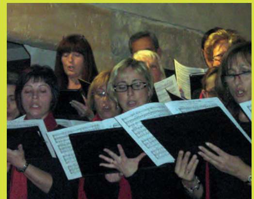
Setmana Santa 2010: Diferents imatges del Xè Camí de la Creu, la processó de Divendres Sant, les cantades de caramelles a càrrec de l'Orfeó Nous Rebrotats i el concert ofert per la coral Santa Rosalia de Torredembarra el Dimarts de Pasqua.