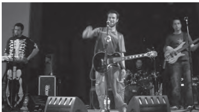
Concert de Kaso Perdido a la Violeta

Primera, perquè és democràtic que sigui entre tots i totes que decidim sobre aquells temes que ens afecten col·lectivament. Segona, perquè és la manera pacífica de prendre decisions col·lectives malgrat les diferents formes de pensar. Tercera, perquè participar és fer que totes les opinions comptin, també la teva, tant si votes que SÍ, que NO o en BLANC. Quarta, perquè és una iniciativa ciutadana. la societat civil també podem prendre iniciatives. És la base de la llibertat. Cinquena, perquè és una consulta oberta a tothom. Catalunya ha estat sempre una terra d'acollida i, per tant, ningú pot quedar