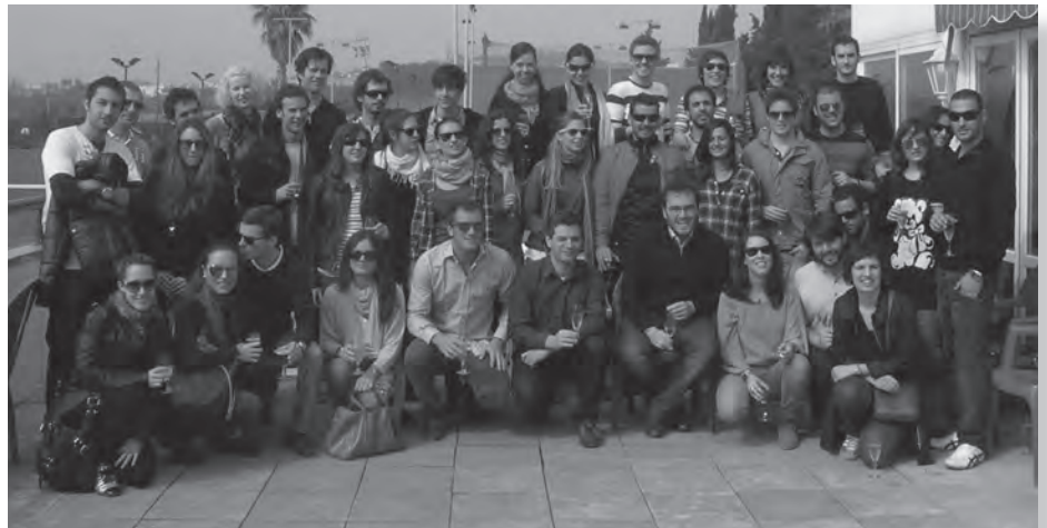
Fotografia en família de "The Glutton Club".

Qui més qui menys, la majoria de catalans fan una calçotada a l'any. Es tracta d'una tradició familiar que va néixer a Valls. Amb els anys, aquesta tradició ha trencat les fronteres de l'àmbit familiar, i fins i tot, geogràfic i s'ha convertit en tot un fenomen econòmic, turístic, social i gastronòmic. Els Germans Blanch d'Altafulla, pagesos de tota la vida, són un dels màxims productors de calçots del Camp de Tarragona que, sota la denominació de la Indicació Geogràfica Protegida (IGP) Calçot de Valls, en produeixen més d'un milió per temporada. Tant és així que els Germans Blanch s'han fet un nom dins la producció del Calçot de Valls i això ha provocat que associacions gastronòmiques d'arreu de l'Estat els visitin. L'associació gastronòmica basca "The Glutton Club" (el Club de los Glotones), creada el desembre del