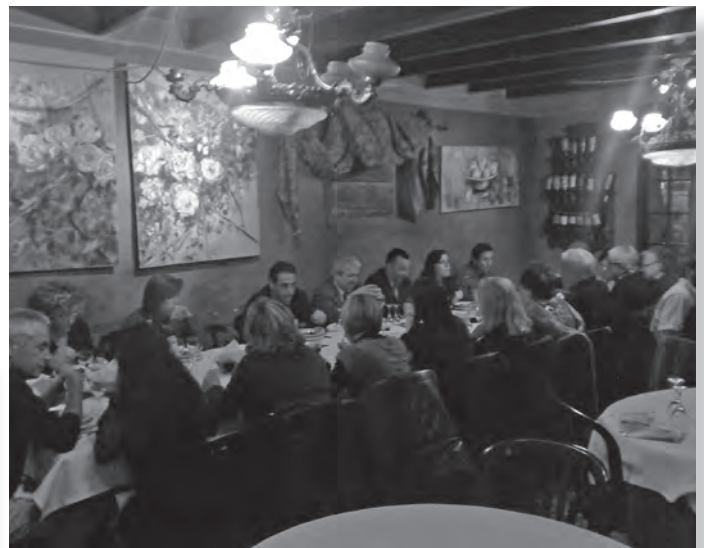
Sopar amb el Cercle Català de Negocis al Faristol

exclòs de participar a la decisió de quin ha de ser el futur del seu país. I sisena, perquè el resultat tindrà efectes, tot i ser consultes oficialment no vinculants. Només cal veure'n el seu ressò nacional i internacional. •