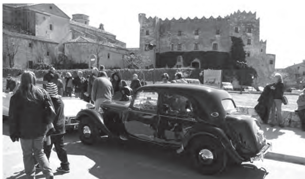
Un Citroën clàssic a les Eres. / Foto: Gregori Barceló

Més de 50 persones aficionades als cotxes clàssics dels anys 50' i 60' de la marca Citroën van visitar el passat 6 de març la Vila Closa d'Altafulla acompanyats naturalment amb un total de 25 d'aquests vehicles d'època. Aquesta activitat s'emmarca dins les visites guiades que organitza la regidoria de Turisme amb la col·laboració del consorci turístic del Baix Gaià i inclou les visites guiades a la Vila Closa i un recorregut pel territori. La jornada festiva va acabar amb una calçotada a Salomó. Segons la regidoria de Turisme, està previst que aquest tipus d'activitats tinguin continuïtat. De fet, per l'any vinent està previst també que s'ampliï amb la visita a la vil·la romana dels Munts.●