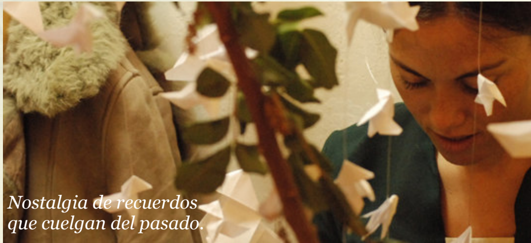
Nostalgia de recuerdos que cuelgan del pasado.