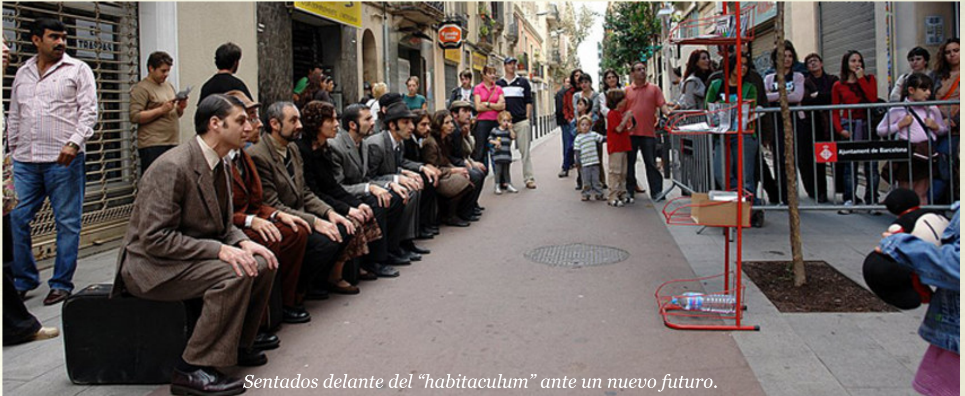
Sentados delante del “habitaculum” ante un nuevo futuro.