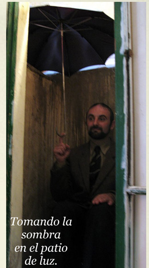
Tomando la sombra en el patio de luz.