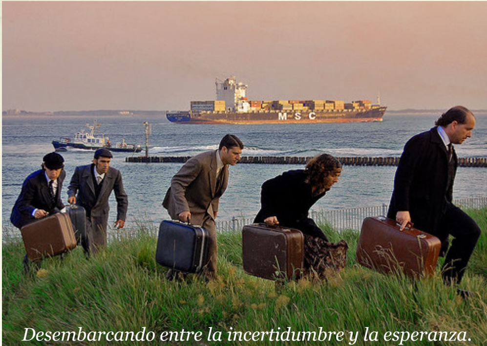
Desembarcando entre la incertidumbre y la esperanza.