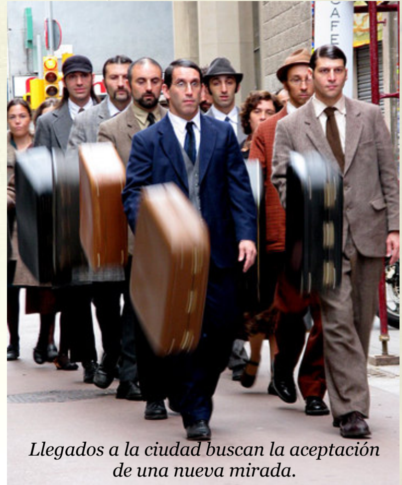
Llegados a la ciudad buscan la aceptación de una nueva mirada.

Kamchàtka: personas llegadas de un país lejano, con sólo una maleta y un recuerdo; ingenuas, curiosas, descubren emociones y crean complicidades con quien se cruza en su camino.