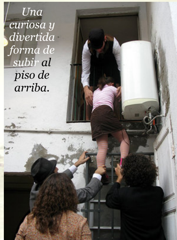
Una curiosa y divertida forma de subir al piso de arriba.