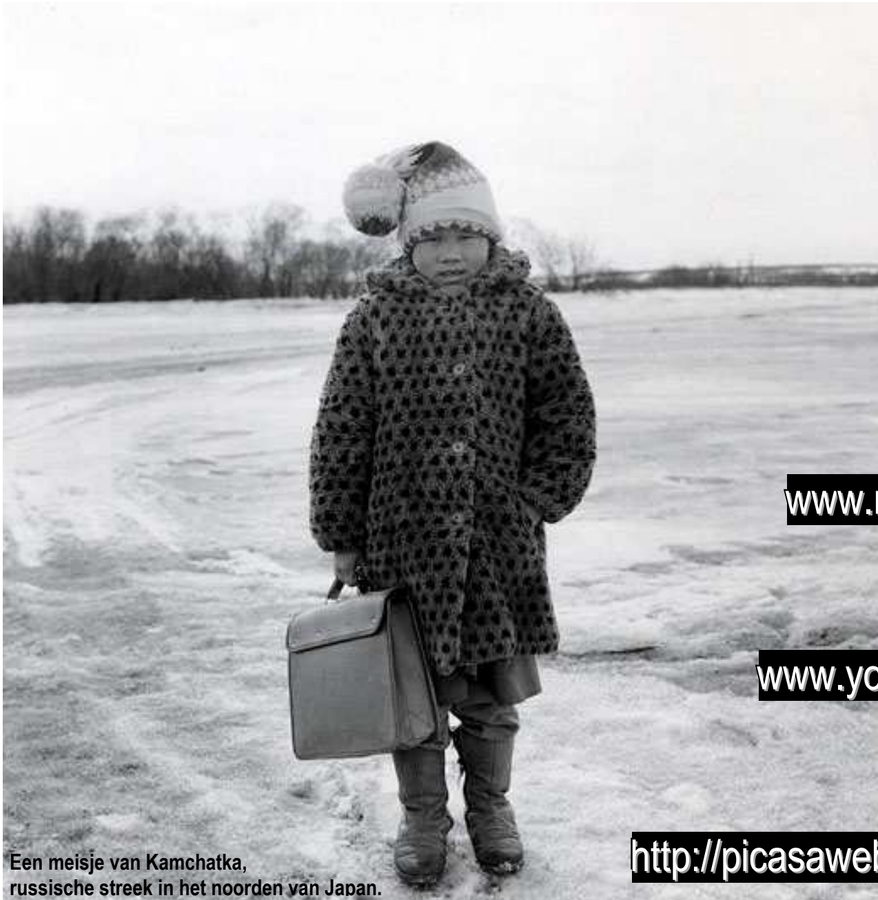
Een meisje van Kamchatka, russische streek in het noorden van Japan.