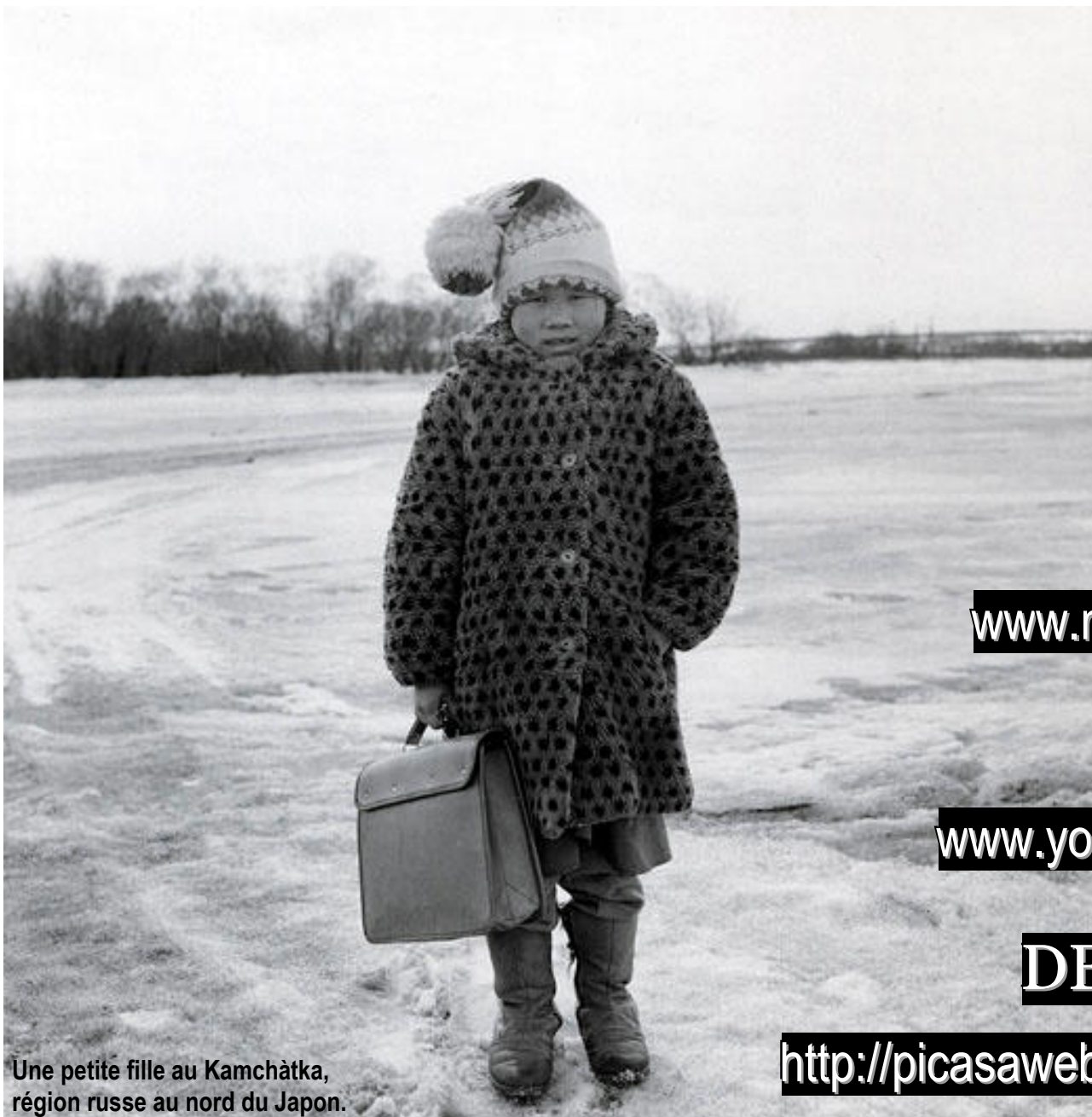
Une petite fille au Kamchàtka, région russe au nord du Japon.