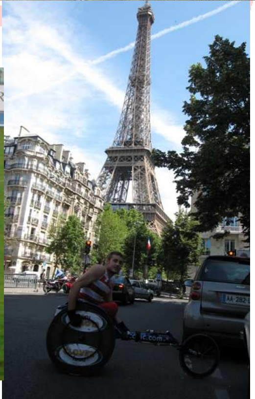
Jocs del Mediterrani