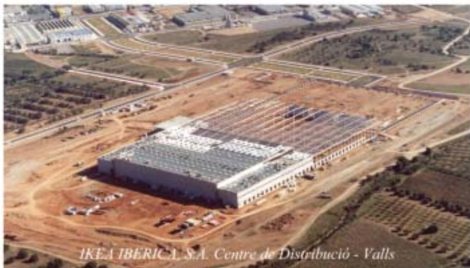
IKEA IBERICA, S.A. Centre de Distribució - Valls