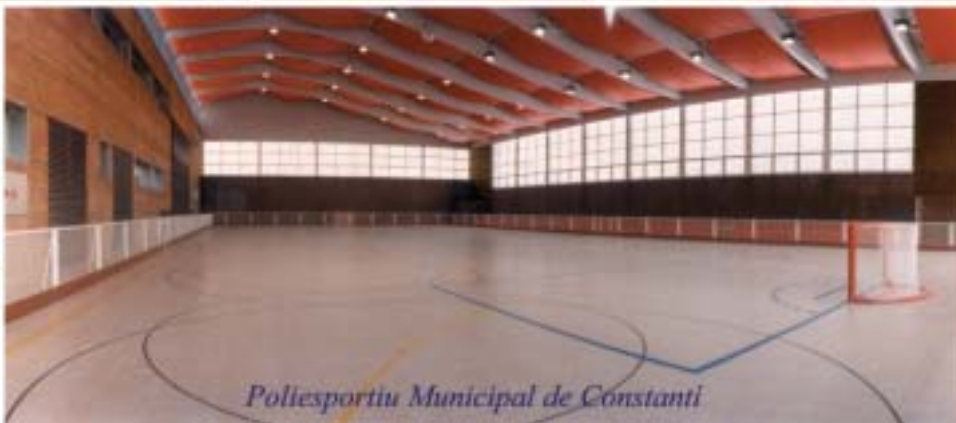
Poliesportiu Municipal de Constantí