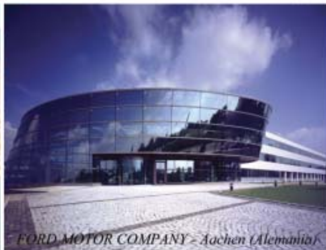
FORD MOTOR COMPANY - Aachen (Alemanya)

En el sector de la construcció, Carbonell Figueras, S.A. li proporciona una solució a la seva mida basat en: