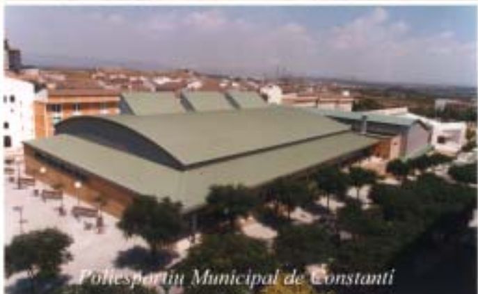
Poliesportiu Municipal de Constantí