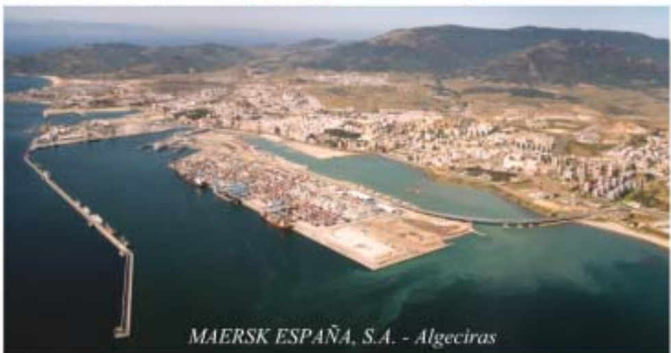
MAERSK ESPAÑA, S.A. - Algeciras