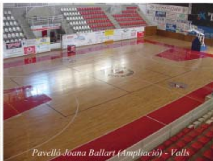
Pavelló Joanà Ballart (Ampliació) - Valls