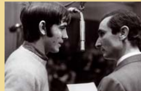
Serrat i Escamilla.

1962. 13 de desembre: Raimon triomfa en la seva primera actuació a Barcelona, a l'hotel Colón, en l'acte de concessió dels premis literaris de la Nit de Santa Llúcia.