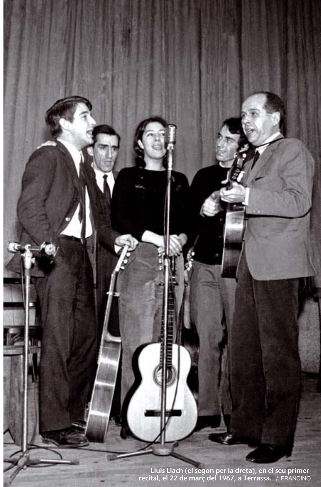
Lluís Llach (el segon per la dreta), en el seu primer recital, el 22 de març del 1967, a Terrassa.