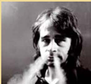
Ovidi Montllor.

da efímera (es dissoldran a mitjan 1969) però fecunda, organitza un festival de folk al parc de la Ciutadella de Barcelona, al qual hi assisteixen milers de persones.