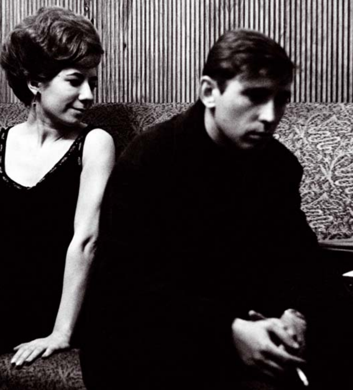
Maria del Mar Bonet a l'auditori de Palma el 1973. A la dreta, Joan Manuel Serrat, Núria Feliu i Raimon el novembre del 1965 al Palau de la Música.