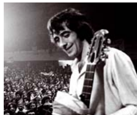
Quan tot semblava possible. A dalt, les Sis Hores de Cançó de Canet l'any 1976 (foto de Colita). Al centre, La Trinca el 1969 (Colita) i el Festival de Folk a la Ciutadella el 1968 (foto de l'arxiu de Jordi Roura). A sota, Llach i Pi de la Serra durant els seus recitals el 1976 al Palau d'Esports (Pilar Aymerich) i Serrat, el mateix any, en un dels recitals de la sèrie de concerts Serrat als barris (Colita).