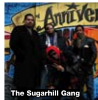
The Sugarhill Gang