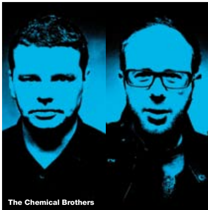
The Chemical Brothers