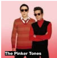
The Pinker Tones