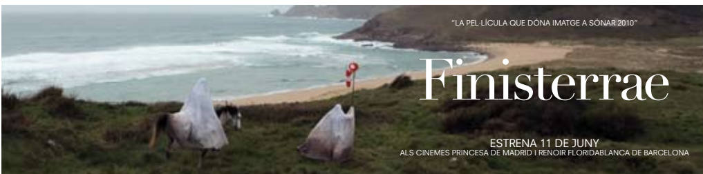
"LA PEL·LÍCULA QUE DÓNIA IMATGE A SÓNAR 2010"