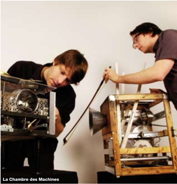
La Chambre des Machines