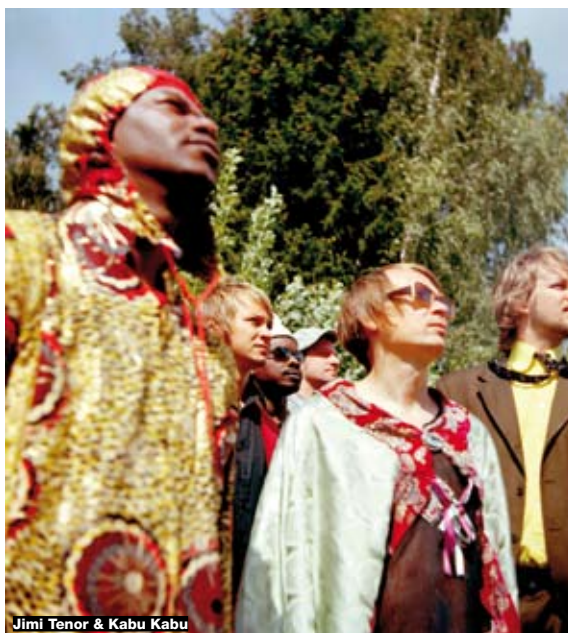
Jimi Tenor & Kabu Kabu