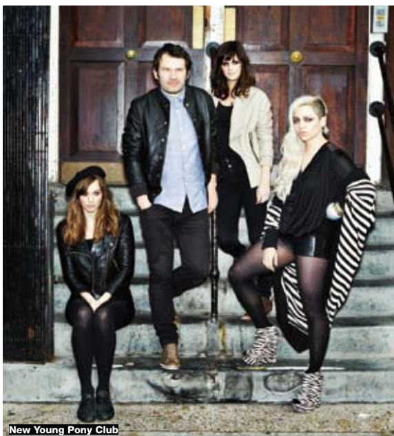
New Young Pony Club