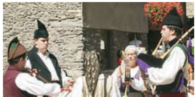
BUNERS A ORDINO. Aquesta festa de la música tradicional aplegarà a la població andorrana d'Ordino, els dies 7 i 8 d'agost, formacions d'Astúries, Hongria, Galícia, Catalunya, Irlanda, Occitània i Bèlgica.