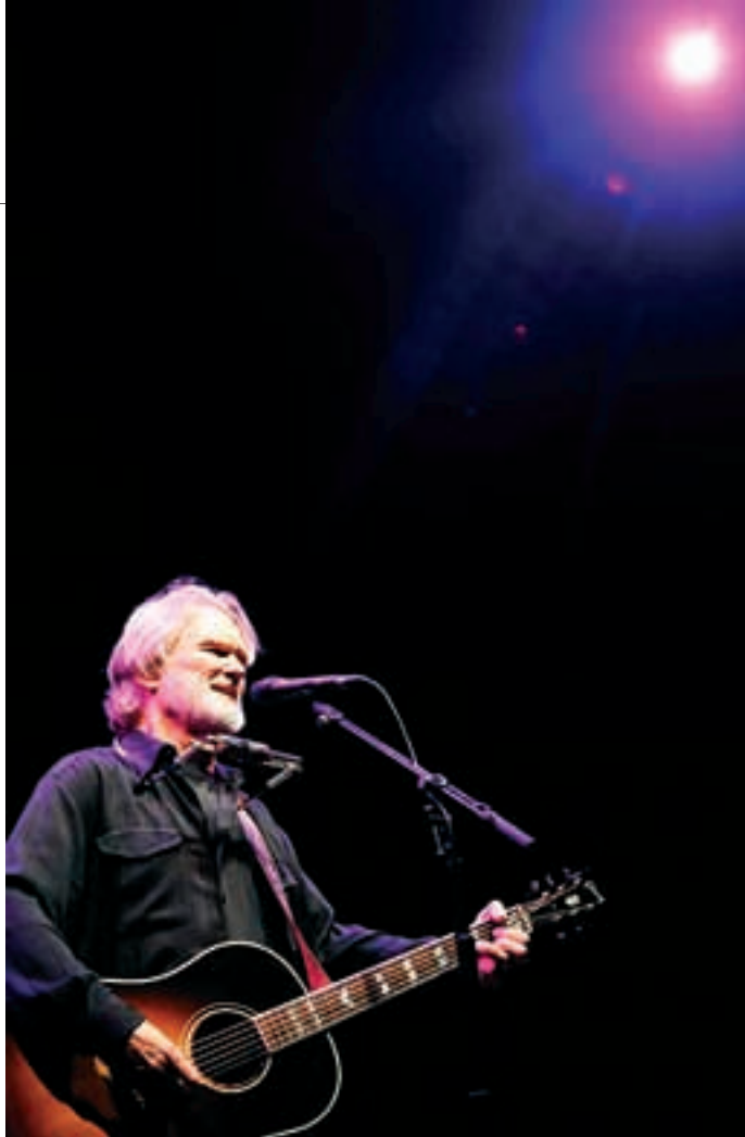
Kris Kristofferson actuarà sol amb la seva guitarra.

Nom del festival: Festival Internacional de la Porta Ferrada Grups i actuacions: Kris Kristofferson. 24 de juliol. Sant Feliu de Guíxols