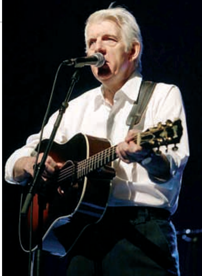
Nick Lowe impartirà una lliçó de classe a Vilanova.