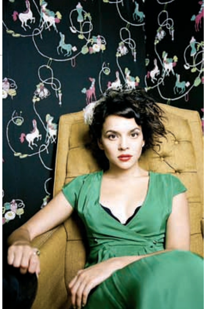
Norah Jones presentarà a Peralada The Fall .