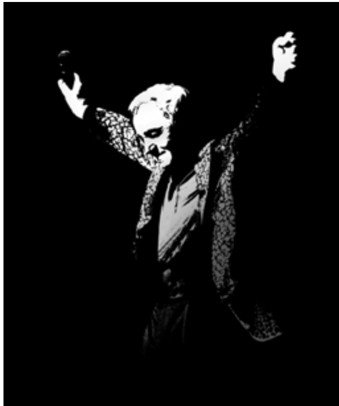
Charles Aznavour oferirà dos concerts al festival de Cap Roig.

Nom del festival: Festival Jardins de Cap Roig Actuació: 16 i 17 d'agost. Jardins de Cap Roig. Calella de Palafrugell