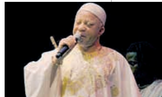
El músic malià Salif Keita.

viatge musical per Europa, Sud-amèrica i Àfrica. Un viatge on hi cap des de la poesia medieval catalana a la cançó protesta o el rock brasiler i espanyol. I tot, gràcies a la seva capacitat poliglota, amb els sons de cinc llengües diferents.