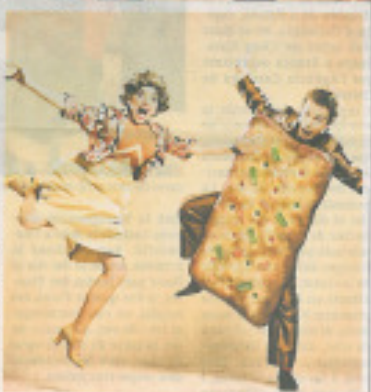
Dues imatges professionals de l'espectacle 'La Nit de Sant Joan'.