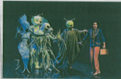
Instante del montaje 'Nit de Sant Joan' de la compañía catalana Dagoll Dagom.

Por su parte, 'Seis clases de baile en seis semanas' presenta a dos personajes solos, ahogados, atenuados y llenos de prejuicios que se encuentran a través del baile. Michael y Lily conforman una pareja imposible. Ella con un pasado estremadamente conservador, insatisfecho y repleto de emociones reprimidas; y Michael, persona difícil, convencido