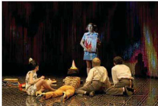
L'espectacle, ahir, a l'Auditori.

Amb músiques de Jaume Sisa, La Nit de Sant Joan es planteja com un musical "galàctic" amb tocs "naif". Els seus protagonistes viuran, així, els seus somnis més amagats, tot fent una oració al voltant de la foguera de Sant Joan. • dB