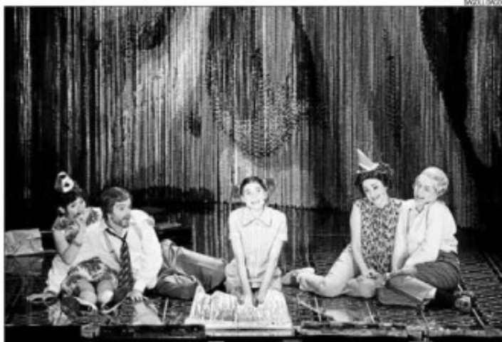
Dagoll Dagom ha posat sobre l'escenari novament un muntatge que va entusiasmar fa prop de trenta anys

Argumentis no els falten ni a Alberola ni a Periel, perquè la capital del Bages és una de les places fortes d'una companyia que, al llarg de tres dècades i mitja, ha revolucionat el món del teatre musical català. L'última demostració d'aquest afecte mutu són les quatre funcions de la nova Nit de Sant Joan que es representaran entre dissabte i diumenge a la Sala Gran del Kursaal. Un pòquer de funcions que signifiquen la gran presentació en societat d'un espectacle que fins ara només s'ha vist a Rubí i Mallorca i que ha vist postergat el seu debut a Barcelona perquè el nou teatre Arteria Paral·lel no obri-