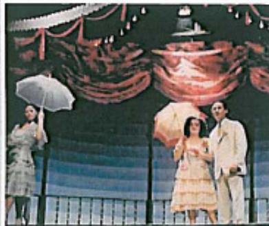
Moment de l'obra, en la representació del 1961

Galrebé 30 anys més tard de la seva estrena, Dagoll Dagom recupera aquest clàssic de la seva trajectòria per fer revivir la festa del solstici d'estiu, amb humor i música, als espectadors de l'Auditori de Palma.