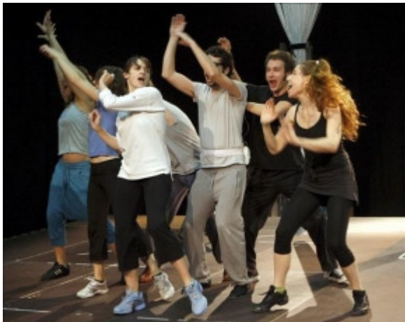
Imatge dels assajos de Dagoll Dagom