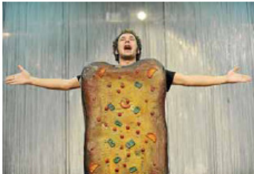
Dagoll Dagom recupera la seva Nit de Sant Joan.