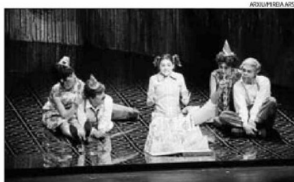
La nit de Sant Joan va fer la seva posada de llarg a Manresa

Entre els seients hi havia gent que ja l'havia vist el 1981, l'any que es va estrenar al teatre Romea de Barcelona. També es va poder veure a Manresa a la llavors sala Loliola, ara a punt de passar definitivament a la història si s'acaba enderrocant. Ja situats al 2010, i al teatre Kursaal, hi havia gent que vo-