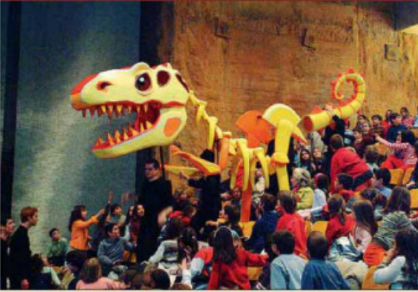
'L'orquestra va de festa' està adreçat a nens de més de 4 anys ■ PALAU DE LA MÚSICA