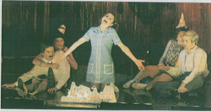
Algunos de los actores de 'Nit de Sant Joan', ayer en el Auditorium durante un ensayo.

TEATRO Dagoll Dagom revive en el Auditorium uno de los montajes que le convirtieron en referente de la escena catalana • El musical se puede ver hoy a las 20.00 horas