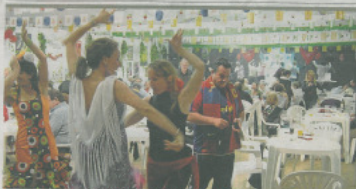
CUNIT CELEBRA FINS DIUMENGE LA FERIA DE ABRIL //P41

El XXX Festival Pau Casals s'inaugurarà amb obres inèdites del mestre //P50