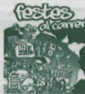
Una propuesta atrevida.

■ RECLAIM THE STREETS. PLAZA DE LA RIERA SA FELCINA, PALMA.