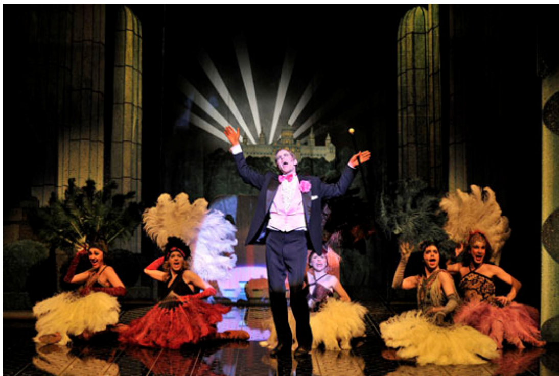
Intantània d'un dels esquetxos de "Nit de Sant Joan".

Nit de Sant Joan, un espectacle de Dagoll Dagom i Jaume Sisa, es representarà el proper divendres dia 26 a les 22 hores (única representació) a l'Auditori Felip Pedrell de Tortosa.