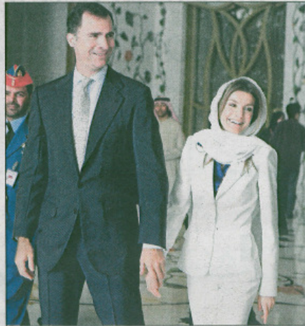
Los Príncipes, ayer, en la mezquita del jeque Zayed de Abu Dhabi.

Cuando trascendieron las últimas voluntades del empresario, fuentes de la Casa del Rey precisaron que los Príncipes no habían mantenido nunca contacto alguno con Balada ni habían recibido información sobre él hasta que el albacea se puso en contacto con ellos hace unos días para comunicarles lo dispuesto por el empresario. El menorquín dividió su fortuna en dos mitades, una para los Príncipes y los ocho nietos de los Reyes y la otra para que el heredero crease una fundación benéfica.