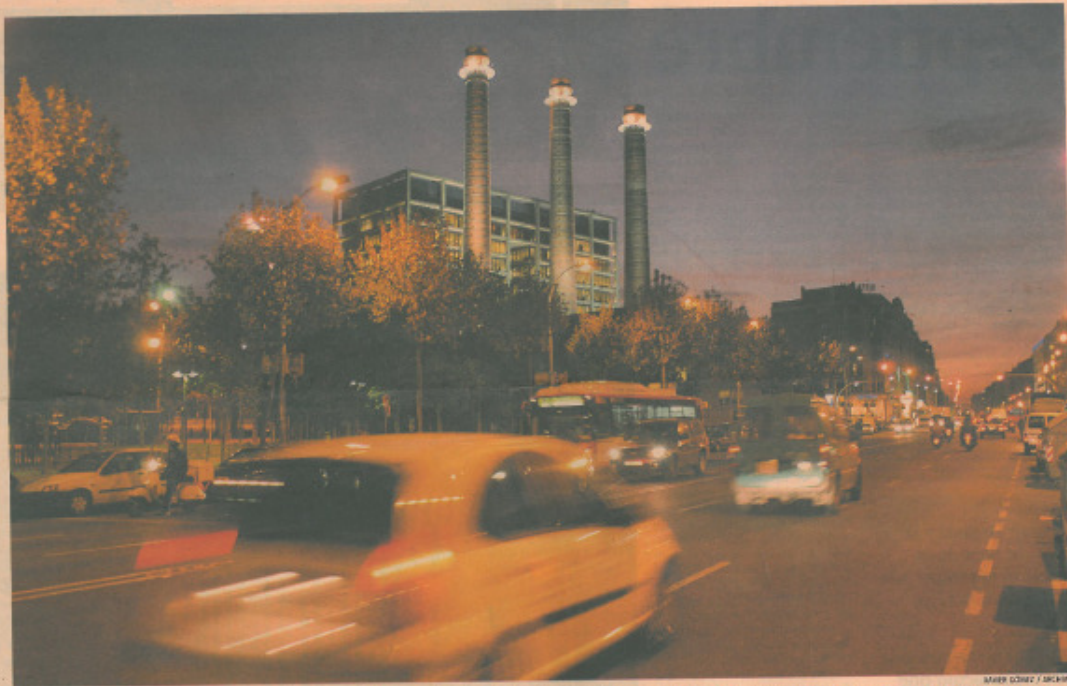
Cambios en la avenida. Mañana los coches no serán los propietarios del Paral·lel, que se convertirá en un escenario para la música, el baile y el deporte