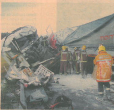
Imagen que muestra la violencia del siniestro

abandonaron el local tras protagonizar un incidente en su interior y minutos después reaparecieron a bordo de un vehículo. Sin hárjase del coche, uno de ellos sacó una escopeta por la ventanilla y disparó contra el portero. Fue un tiro de postas que alcanzó a la víctima en la espalda. Una hora después los Mossos —que montaron un amplio dispositivo para arrestarlos— los detuvieron en Bellpuig. Ya no llevaban la escopeta y han sido acusados de homicidio en grado de tentativa. / J. Ricou