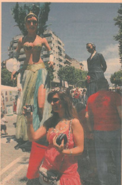
Un pasacalles recorrió la avenida a primeras horas de la tarde