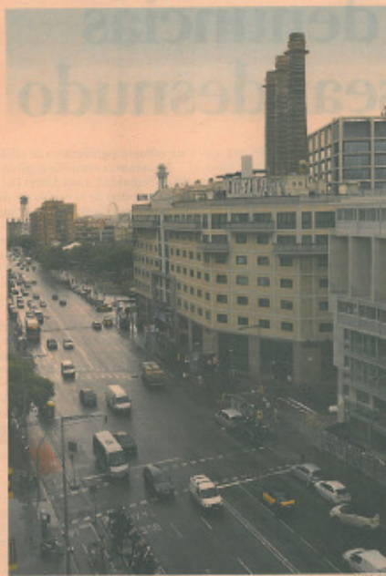
El Paral·lel, ayer, con las tres chimeneas de fondo