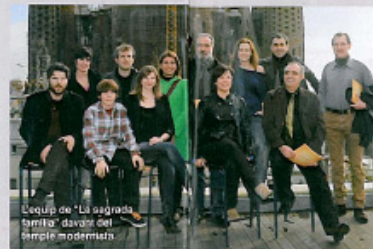
Equip de “La sagrada família” davant del temple modernista.