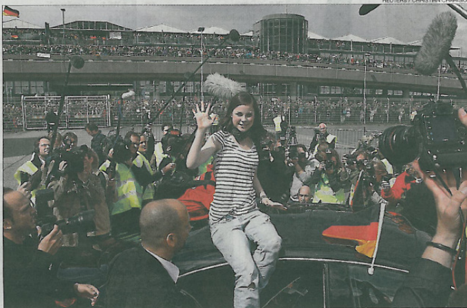
La cantant Lena Mayer-Landrut, envoltada per càmeres i fans, a l'arribar a l'aeroport de Hannover.

Però va ser seleccionada amb 19 finalistes més. I va anar superant cada fase fins a arribar a Oslo. En tan sols un mes, va enamorar tot Alemanya. No és una exageració: les tres cançons que va interpretar perquè el públic elegís quina volia al certamen es van col·locar entre les cinc més venudes a iTunes en només 10 dies. A principis de maig va publicar