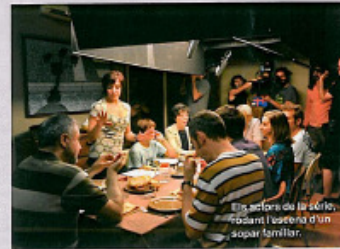
Un actor de la sèrie, fent el paper d'un sopar familiar.

La nova família televisiva del Jordi divertex molt a l'actor. «Es fa el contrapès entre els problemes de la nostra família i les que la Renetx coneix a la feina, basades en casos reals. Veiem molts conflictes des de fora i és així com podem riure de nosaltres mateixos, diu, encantat.