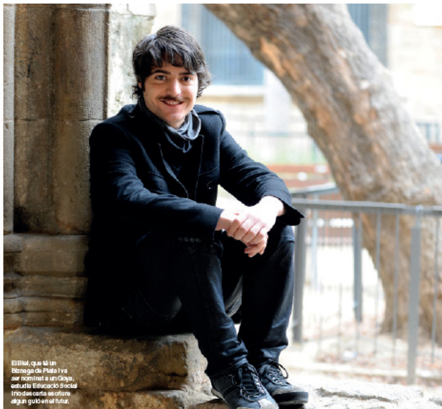
El Biel, que té un bitnaga de Plata i va ser nomenat a un Goya, estudia Educació Social i no dosanta se cifre algun guion en el futur.

ballant a Madrid i fent, allà i a Barcelona, teatre, cinema i televisió», diu l'actor, molt content d'haver participat a “La memòria dels cargols” en el seu moment i ara a “La sagrada família”. «“La memòria dels cargols” la recordo com una sèrie de culte. Hi ha molts seguidors que la revisiten ara al canal 300. Tinc molt bon record, és de les millors coses que he fet... Així que tornar a treballar amb Dagoll Dagom, aquest cop a “La sagrada família”, va ser una gran notícia per a mi. És un projecte que no té res a veure, però precisament per això m'atrau Dagoll, perquè busquen noves maneres d'enfocar la comèdia. “La sagrada família” és una oportunitat per conèixer una comèdia que no renunciava a estar ben feta, que busca l'excel·lència tècnica i interpretativa», diu l'actor, qui assegura passar-ho molt bé amb aquesta sèrie. «L'ambient és una passada, perquè els Dagoll són molt càlids i propers i és un gust treballar amb ells perquè això