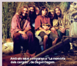
Amb els seus companys a “La memòria dels cargols”, de Dagoll Dagom.