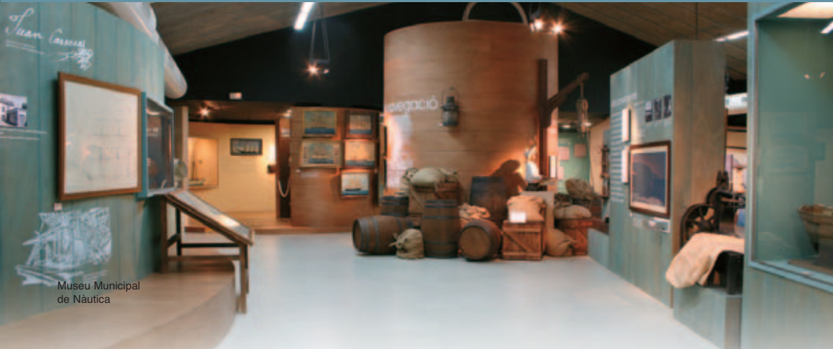
Museu Municipal de Nàutica