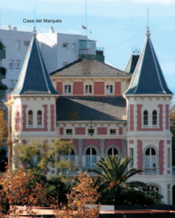
Casa del Marquès

A més a més, passejant en direcció al mar s'accedeix fins al mirador del Bell Resguard on es pot contemplar una magnífica vista del mar.