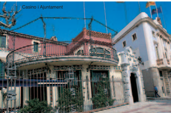
Casino i Ajuntament

El teatre, és d'estil romàntic i neoclàssic, i està compost per una balconada correguda de forma semicircular sostinguda per unes columnetes de ferro colat.