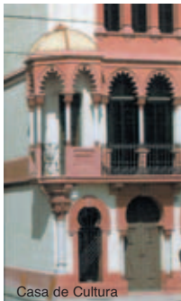
Casa de Cultura