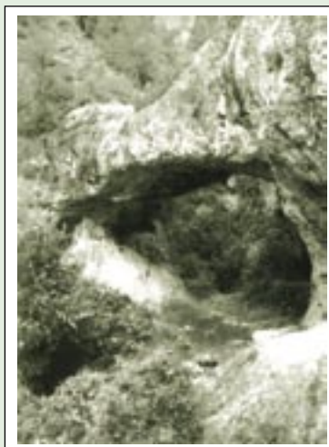
Boca del forn de calç olesà conegut com el de l'Home Mort.