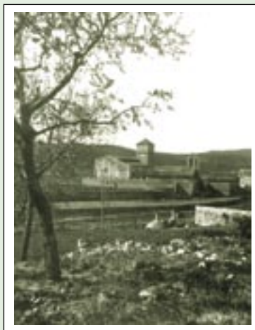
Les escoles públiques dels anys trenta, sota el campanar de la parròquia.