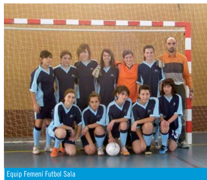
Equip Femení Futbol Sala

Aquesta temporada el CEDI, en la disciplina del futbol sala, juga en una nova competició. Les categories d'infantil i cadet, alumnes de 1r i 2n i 3r i 4t d'ESO, respectivament, competeixen en les lligues organitzades per la Federació Catalana de futbol sala. Això ha estat possible, gràcies, al nivell que han assolit els nostres jugadors després de varis anys de practicar aquest esport. Per l'equip d'entrenadors del CEDI, aquest fet ens esperona per tal de seguir treballant en la mateixa línia, i alhora ens serveix d'estímul per millorar en aquells aspectes que s'han de corregir, polir o bé, incorporar-ne de nous, en els equips de base del club, que no són altres, que el nens i nenes de pre-benjamí, benjamí i aleví.