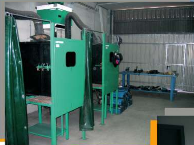
AULA DE SOLDADURA