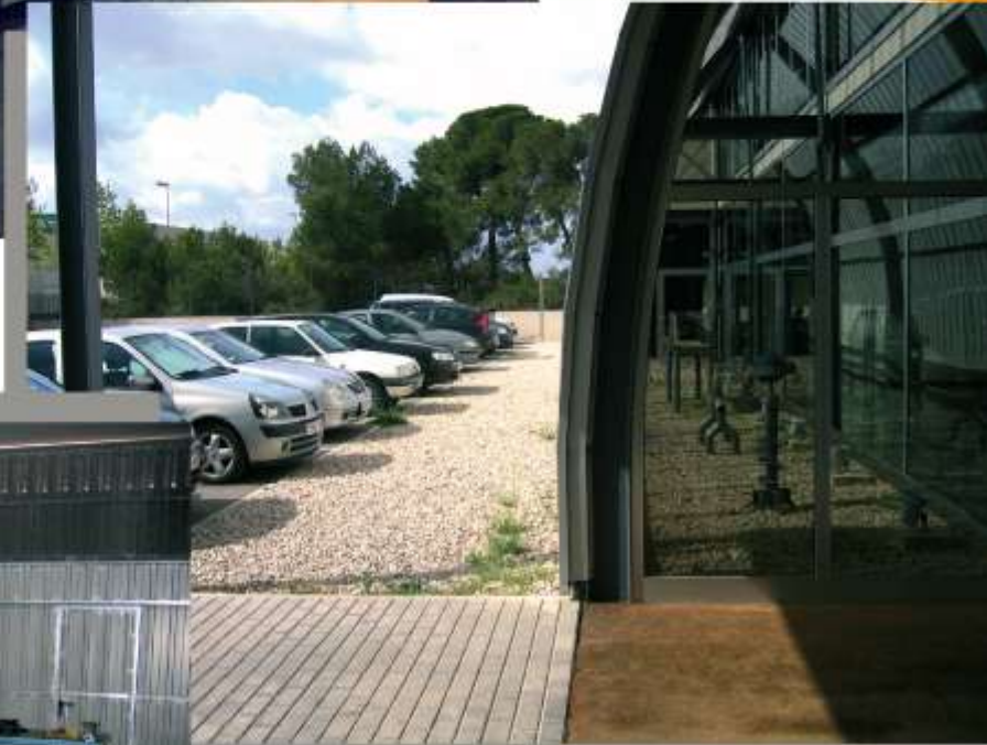
ENTRADA I PARKING