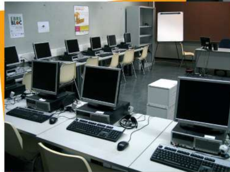
TELECENRE BAIX EBRE