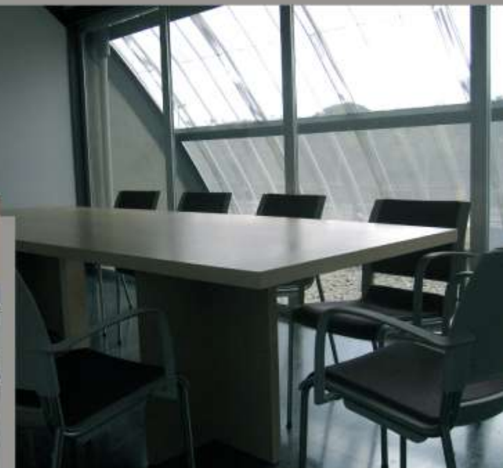
SALA DE REUNIONS