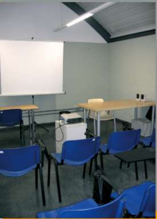
AULA DE FORMACIÓ