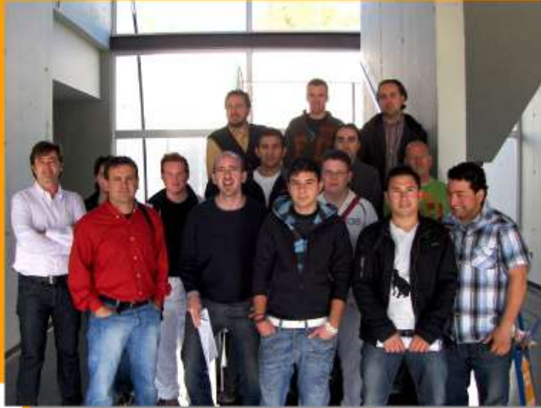
PROMOCIÓ DE NOUS SOLDADORS