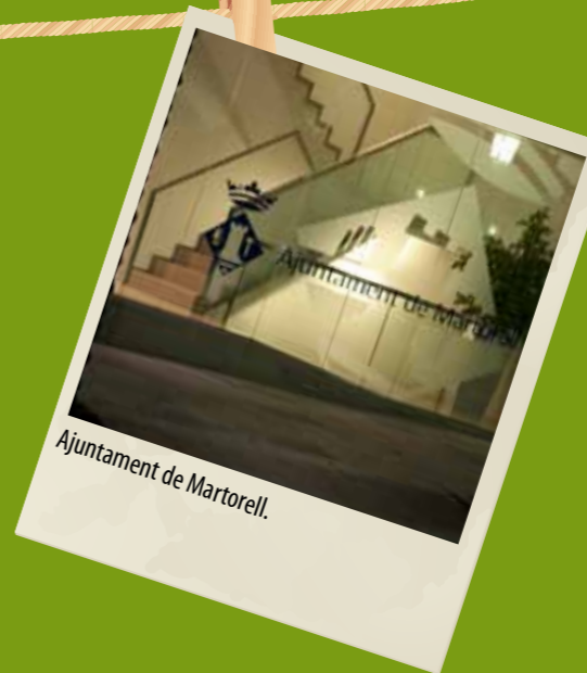
Ajuntament de Martorell.