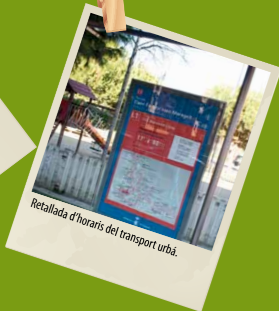
Retallada d'horaris del transport urbà.