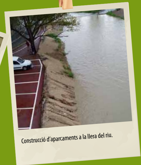
Construcció d'aparcaments a la llera del riu.