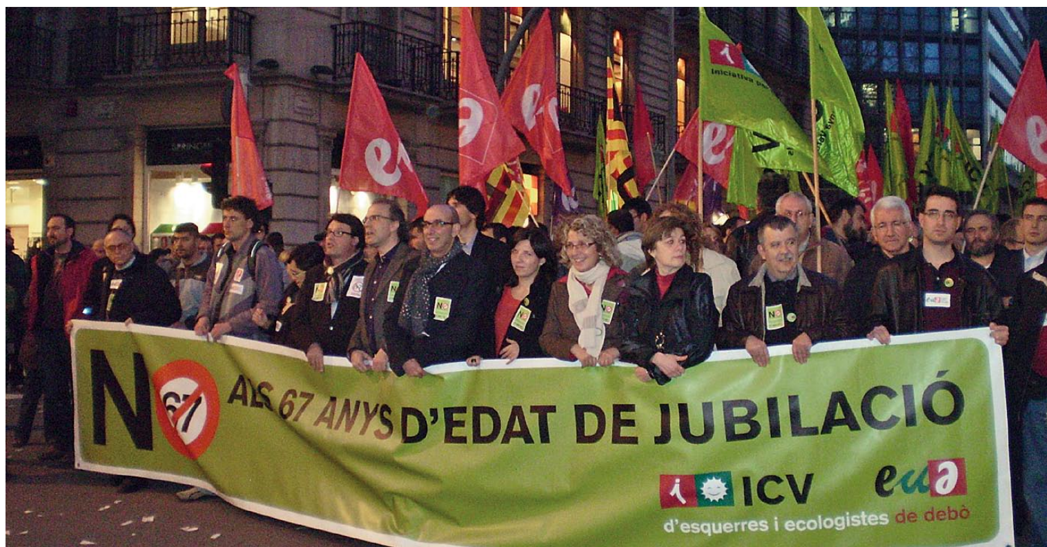
Capçalera d'ICV-EUiA a la manifestació del passat 23 de febrer a Barcelona en protesta contra la mesura de retardar la jubilació als 67 anys.

Cal recordar que una altra de les mesures injustes aprovades pel govern de l'Estat ha estat la pujada de l'IVA, una mesura que també ha fet perdre poder adquisitiu als i les pensionistes. Recordem que a Espanya hi ha 8,5 milions de pensionistes, dels quals 2,3 milions tenen pensions mínimes; per a la resta (6,2 milions) el pla proposat pel govern suposarà la congelació de la seva pensió ■