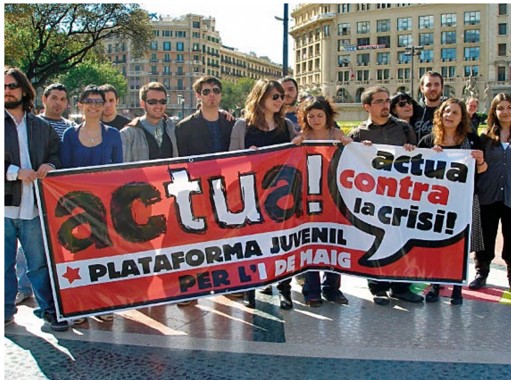
Joves d'Esquerra Verda a l'acció directa de la plataforma Actua! el darrer primer de maig

Actualment, al conjunt de l'Estat, la meitat del jovent assalariat (48,42%) té contractes temporals, que arriben a l'escandalós 79,6% en el cas de les persones d'entre 16 i 19 anys.