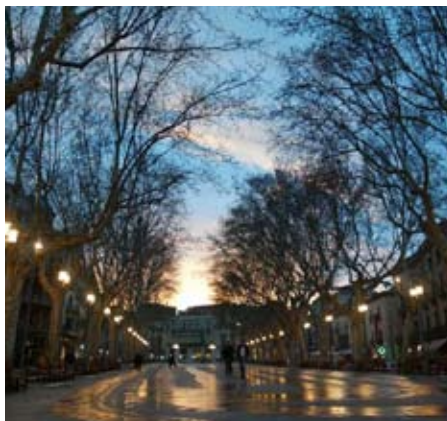
Rambla de Figueres (Alt Empordà)

39. Cal que les COMARQUES GIRONINES disposin d'una estratègia pròpia d'execució de polítiques de lluita contra el canvi climàtic . Estudiar la implementació d' ecodistrictes a les COMARQUES GIRONINES. Promoure una política mediambiental que tingui en compte el medi natural però també sigui capaç de tenir en compte la humanització del territori i dels que hi viuen i moltes vegades