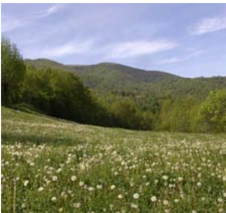
Pardines (El Ripollès)

23. Definir conjuntament amb les institucions de les COMARQUES GIRONINES àrees d'alt valor estratègic econòmic i dotar-les d'avantatges i facilitats en matèria urbanística, d'accés a infraestructures, mobilitat, abastaments bàsics i avals públics per a la implantació d'indústries, serveis i centres de recerca privada.