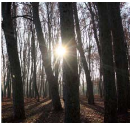
La Fageda d'en Jordà (Garrotxa)