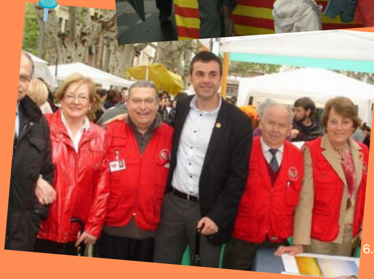
1. Santi Vila, a la Festa de CiU a Vic/ 2. Santi Vila en un acte de CiU a la Rambla de Figueres/ 3. Artur Mas, Santi Vila i Eudald Casadesús en un acte de CiU/ 4. Carles Puigdemont i Santi Vila al Parlament de Catalunya/ 5. Santi Vila en una parada de CiU/ 6. Santi Vila en una parada de l'associació CORFI el dia de Sant Jordi.