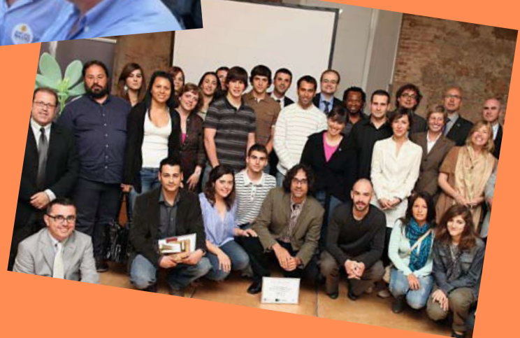
1. Josep Rull, Carles Campuzano, Jordi Cuminal, Gerard Figueres, Artur Mas, Santi Vila, Jordi Xuclà, Albert Batalla i Lluís Recoder, a l'acte de celebració dels 30 anys de la JNC a Platja d'Aro/ 2. Santi Vila, a la primera cursa urbana de Sant Josep/ 3. Artur Mas i Santi Vila a Lloret amb la candidatura CiU per Girona a les eleccions al Parlament de Catalunya 2010/ 4. Santi Vila i en Mia Corominas, candidat de CiU a l'alcaldia d'Olot, a la manifestació del 10 de juliol a Barcelona de resposta a la sentència del TC/ 5. Artur Mas i Santi Vila en un acte de CiU/ 6. Santi Vila amb els emprenedors de l'Alt Empordà guardonats.