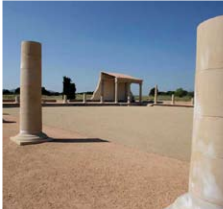
Ruïnes grecoromanes d'Empúries

11. Fer efectives les accions d'Emergències que incorporen els plans sectorials, per fer front a situacions de risc per al conjunt de les COMARQUES GIRONINES i prevenir-ne els efectes. Elaborar en coordinació amb les administracions locals implicades una auditoria dels protocols vigents per tal de millorar la seva implementació que inclogui una descrip-