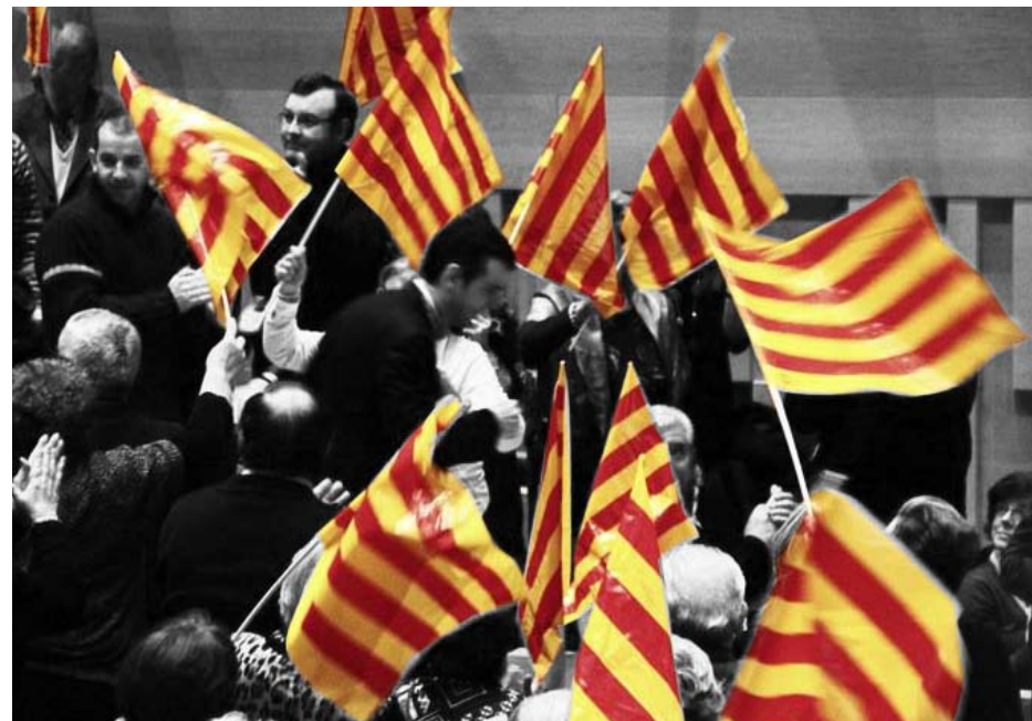
Acte de proclamació de Santi Vila com a cap de llista de CiU en les eleccions al Parlament de Catalunya.

Els de la meva generació hem nascut i crescut en un marc de democràcia i progrés ininterromput, en bona mesura insòlit i sense precedents, que ha permès parlar de la història recent de Catalunya i d’Espanya com una història d’èxit. El desafiament de la modernitat, que fa trenta anys va situar com a reptes a assolir la consolidació d’una veritable economia social de mercat oberta al món, sense intrusismes ni atrofies estatals; la definició d’un Estat del benestar modern garant dels drets fonamentals, de seguretat i llibertat i l’encaix de la diversitat nacional espa-