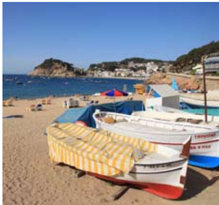
Tossa de Mar (La Selva)

ció de necessitats a resoldre, una previsió d'equips de comandament i direcció, revisió dels mecanismes de coordinació i direcció d'actuacions en les quals hi haurà agents públics i privats implicats. Establir un mètode d'avaluació continuada. Millorar la gestió i l'operativitat del telèfon d'emergències 112.