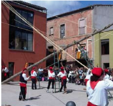
La Festa de l'Arbre i Ball del Cornut de Cornellà del Terri