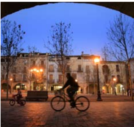
Plaça Major de Banyoles (Pla de l'Estany)