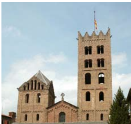
Monestir de Ripoll (Ripollès)

mantenen viu el paisatge i el medi natural.