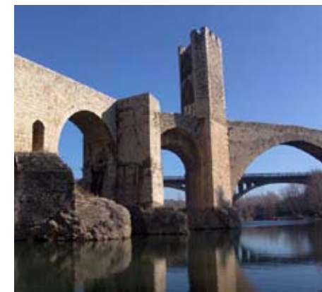
Pont de Besalú (Garrotxa)