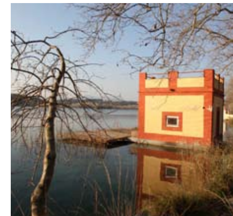
Estany de Banyoles