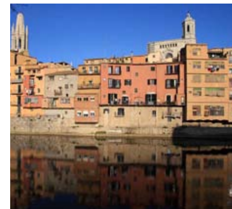
Casades de l'Onyar (Girona)

Posar fi definitivament a la insuficiència energètica de la regió de Girona. Les COMARQUES GIRONINES han de desenvolupar el seu potencial en matèria d'energia eòlica—prioritzant la seva instal·lació en els corredors de serveis sempre que sigui possible— i en matèria d'implantació de plantes de biomassa. Caldrà resoldre la interconnexió elèctrica amb França.