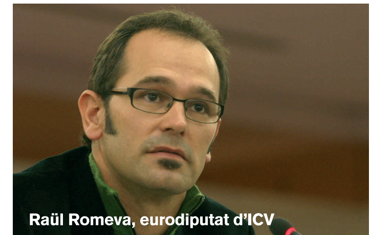
Raül Romeva, eurodiputat d'ICV

7 de juny: Eleccions al Parlament Europeu