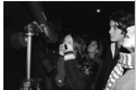
Vam poder fer observació amb potents telescopis