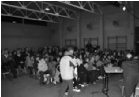
Aspecte del gimnàs durant una presentació

Un any més es va demostrar que ni el fred ni la nit poden res contra aquesta singular celebració, que enguany va aplegar més de 200 persones a l'escola. Els astres es van fer pregar, però finalment sobre les 11 de la nit vam poder veure nítidament la Lluna, Júpiter i els seus satèl·lits , a més de conèixer d'aprop el programa Stellarium , una aplicació que es pot descarregar gratuïtament d'internet i permet explorar tot el firmament (aplicació disponible en català a www.stellarium.org ).