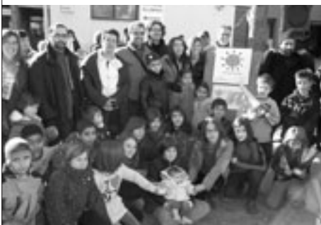
Descobrim la placa que ens reconeix com a Escola Verda

Durant el matí vam aprofitar per inaugurar la placa que ens distingeix com a Escola Verda, reconeixement que hem obtingut recentment. Els guanys del Mercat de les 3R obtinguts per les parades de 6è es destinaran a la seva acampada de final de curs.