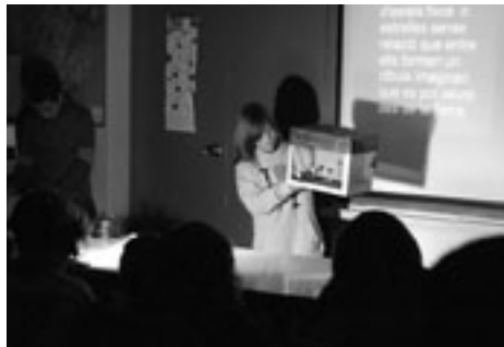
Els nostres fills i filles ens van fer una lliçó magistral