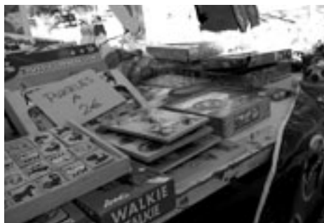
Diversitat en l'oferta i tàctiques comercials agressives!