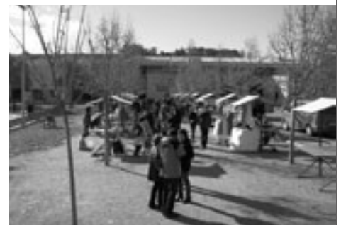
De bon matí el Passeig de la Pau es va començar a omplir