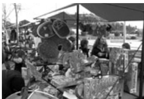
A primera hora les parades estaven farcides del bo i millor!