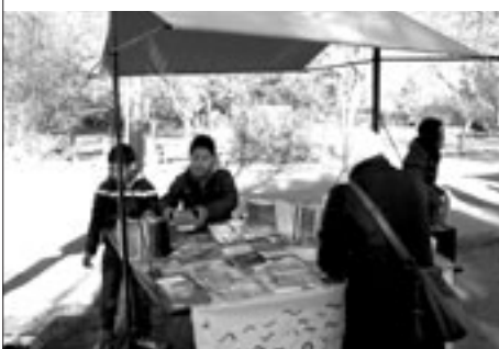
Els de sisè es van treballar molt l'exposició