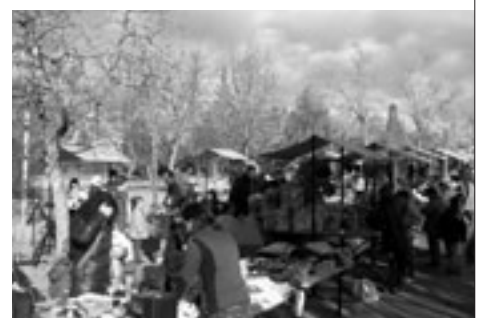
Ens va fer sol tot el matí, tot i els núvols amenaçadors