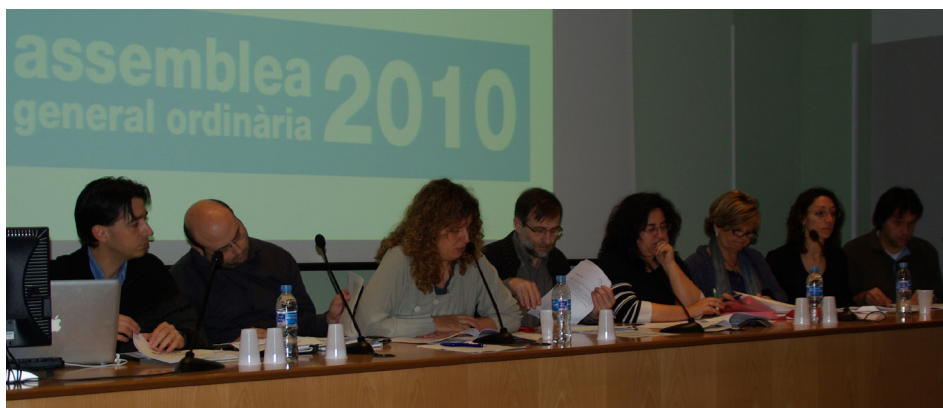
L'actual junta en un moment de l'assemblea.