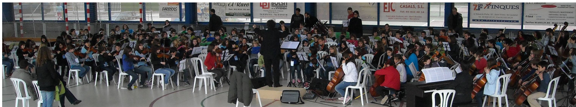
Assaig + Música Zona 6 - Sant Vicenç de Castellet - 21 de març 2010