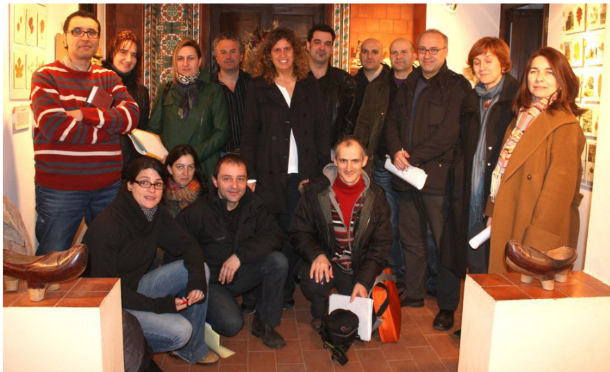
Participants a l'assemblea de la UEMyD celebrada a Noja el 7 de març 2010.