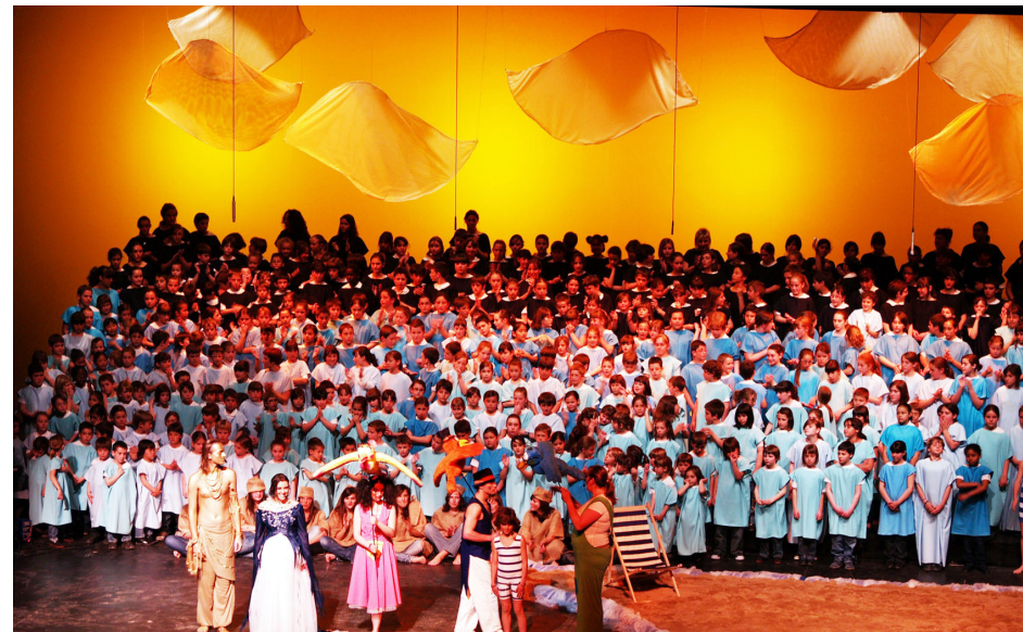
Un moment de la cantata “Et regalaré totes les estrelles del cel”, Lleida 17 d’abril 2010

“Et regalaré totes les estrelles del cel” és una màgica història d’amistat i solidaritat. L’Uriel, un infant de qualsevol racó del món, va descobrir de la mà de l’Estel Polar, la Lluna i altres personatges, els drets dels infants i, alhora, diferents realitats que viuen els nens i nenes d’arreu.