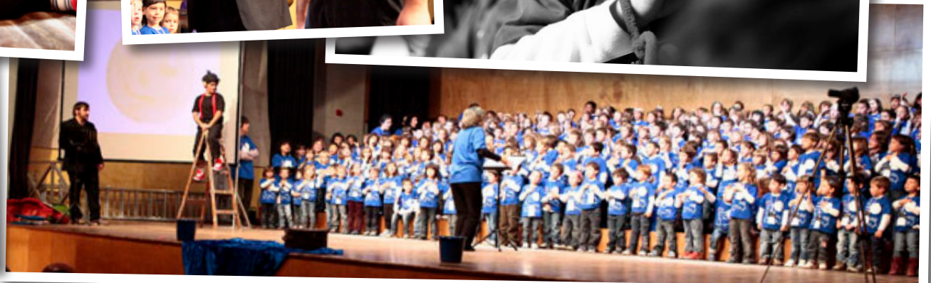
Cantata Zona6 "El nen enamorat de la lluna"