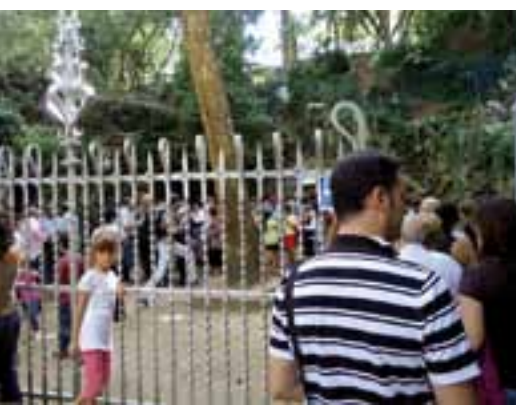
Actualitat * Pàg. 11 La Font Picant torna a rajar