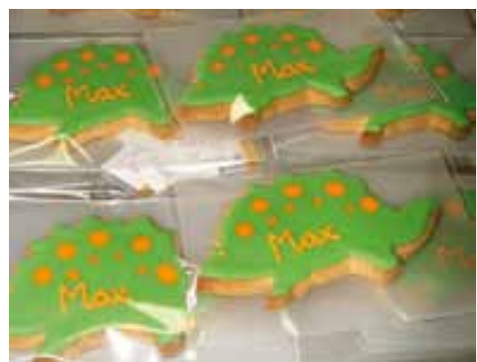
Reportatge * Pàg. 12 Els emprenedors aposten per innovar i especialitzar-se