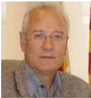
Pep Masó Noguera Alcalde d'Argentona

Les persones han estat, i són, les que sempre fan que una comunitat i tot un poble sigui com és. Amb més o menys encert, les propostes i les accions, siguin d'un grup d'amics, d'una associació cultural, de persones a títol individual o dels governs municipals, han conduït sempre a deixar llur empremta configurant la manera de ser dels pobles.