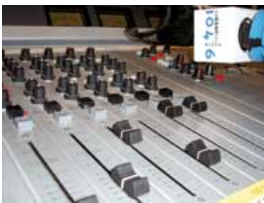
Reportatge * Pàg. 14 Nova temporada de Ràdio Argentona