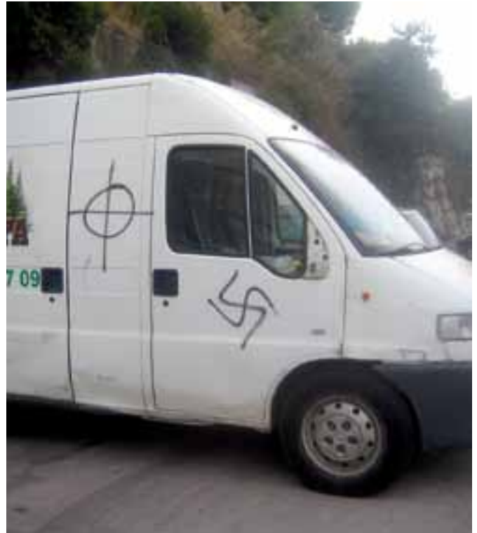
Assemblea Maulets Argentona www.maulets.org/argentona

D'altra banda, caldria esbrinar si l'obsessió dels populars és només pels murals independentistes (amb permís municipal) o també per les pintades que van aparèixer fa uns mesos al poble amb lemes com "Arriba España" i tota mena de simbologia feixista. Cal que es faci justícia i que el PP d'Argentona abandoni el camí de l'hipocresia i el recurs fàcil de la calúmnia.